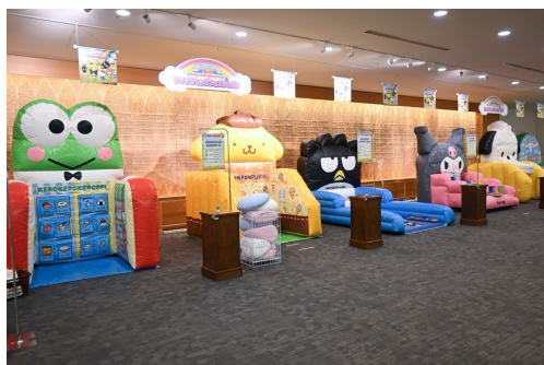
キッズ会場「サンリオキッズフェスティバル」