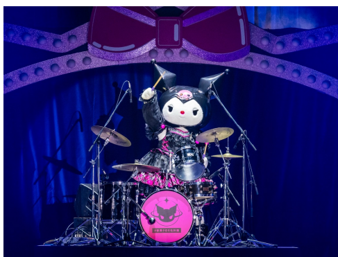
クロミが「Greedy Greedy」でドラム演奏