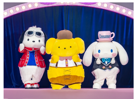
左からポチャッコ、ポムポムプリン、シナモロール

ポムポムプリンは、ファンからのたくさんの応援を受け、2年連続で第1位に。うれしさを全身で表すようにステージ上でぐるっと回り、喜びいっぱいの様子で、「わあ～い！ ぼく、ほんとに1位なの？ やったー！！ みんな、たくさんエールを送ってくれたんだね！ 本当にありがとう。みんなだ～いすき☆ ぼくからもみんなにたくさんエールをおくるから、これからよろしくね。」と、応援してくれたファンへ感謝の気持ちを伝えました。会場からたくさんの拍手とエールに包まれ、キャラクターとファンが互いに応援し、譁え合う「サンリオキャラクター大賞」ならではの温かな空間が広がり、感動的なステージとなりました。