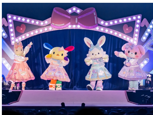
新ユニット「チアスタイルズ」が登場