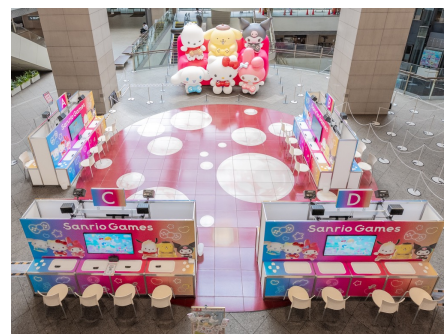
「クイーンズスクエア横浜」サンリオゲームズエリア