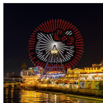
「コスモック21」大観覧車 ※イメージ