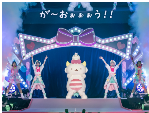
がおぼわろの初登場