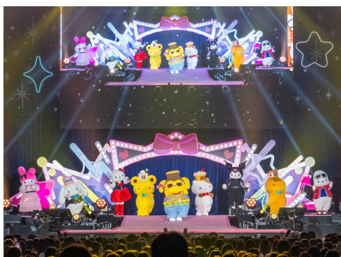
DJパートで盛り上がる、ポムポムプリン喜劇

2日間のフィナーレを飾った「SANRIO KAWAII LIVE」では、サンリオキャラクターたちが登場。チアスタイルズ初のテーマソングを披露、クロミのドラム演奏など、歌やダンスによる元気いっぱいのパフォーマンスで、会場を大いに盛り上げました。来場者も手拍子や声援で応え、ステージと客席が一体となったハートフルな空間が広がりました。サンリオフェスならではの“カワイイ”が詰まったフィナーレにふさわしいステージとなりました。