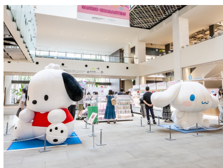
「MARK IS みなとみらい」 Sanrio Puroland 35th Anniversary Shop