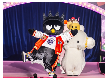
ランウェイでポーズを決める、パッドばつ丸