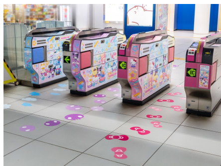
「みなとみらい駅」中央改札装飾

みなとみらい駅周辺施設でもさまざまな施策を展開しました。「みなとみらい駅」や「ランドマークプラザ」、「MARK IS みなとみらい」、「クイーンズスクエア横浜」などがサンリオキャラクターで彩られ、来場者はパシフィコ横浜へ向かう道中や周辺施設を巡りながら、街全体に広がるサンリオフェスの世界観を楽しみました。詳細については、別途 プレスリリース をご確認ください。