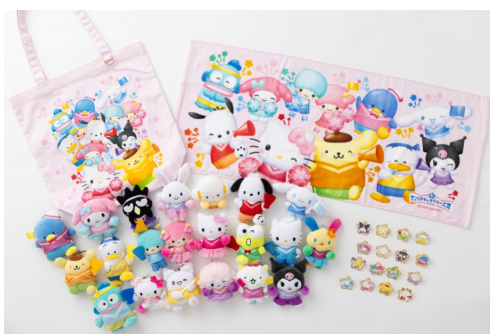
「サンリオフェス2026 in みなとみらい」限定販売商品