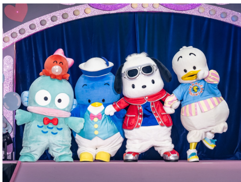
「なかよしエール賞」の受賞を祝福し合う、はぴだんぶい

また、投票期間中に一緒に投票された回数が多い3キャラクターを表彰する「なかよしエール賞」には、「ポチャッコ」「あひるのペックル」「タキシードサム」が選ばれ、はぴだんぶいのメンバーが受賞しました。同じメンバーの「ハンギョドン」もこの快挙を祝福し、はぴだんぶいの絆を感じさせる温かなシーンとなりました。また、今年新設された「2026年サンリオキャラクター大賞 ハッピーナフレンズ部門」では、「ちょこちら」が「いっしょにいたい賞」「たくさんあつめたい賞」「おはなしをみたい賞」の3賞全てで1位を獲得しました。会場からは驚きの声と大きな拍手とエールが送られ、新たなサンリオキャラクターの仲間の活躍を称える場面となりました。