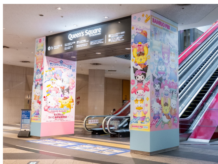
「クイーンズスクエア横浜」エスカレーター装飾