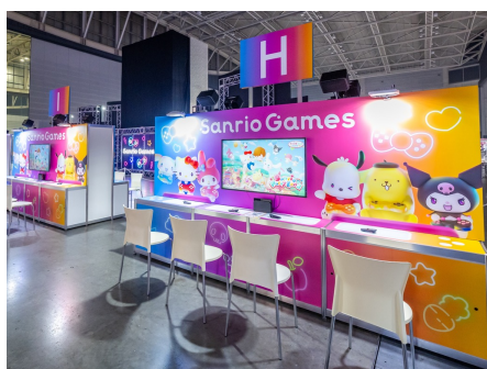
メイン会場「Sanrio Games」の試遊体験