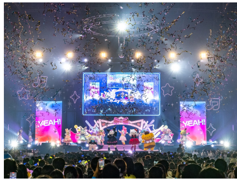
フィナーレで銀てぶが舞う会場内