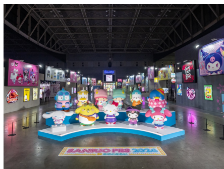
「サンリオフェス2026シティ」コンセプトのメイン会場