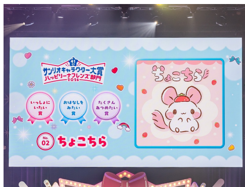
ハッピーナフレンズ部門3賞受賞「ちょこちら」