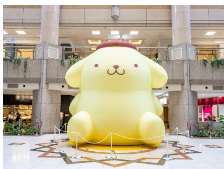
「ランドマークプラザ」ポムポムプリン巨大バルーン