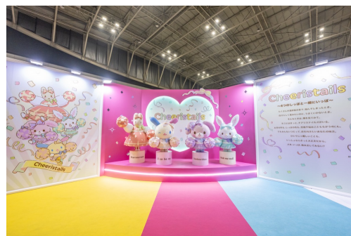
メイン会場「チアリストイルズ」