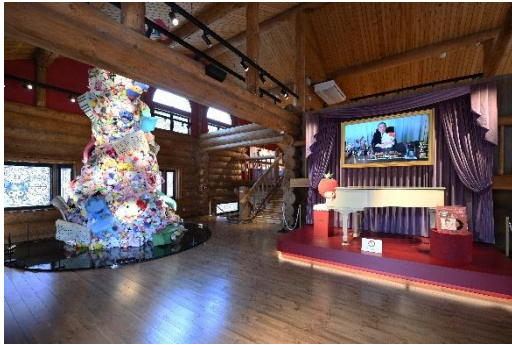
いちごの王さまのウェルカムステージ

いちごの王さまと一緒に、サンリオ初の直営店「新宿ギフトゲート」で使用されていた白いグランドピアノがある「いちごの王さまのウェルカムステージ」にてお客さまをお迎えます。また、1975年の創刊以来、いちご新聞が読者である「いちごメイト」とともに歩んできた歴史を展示する「いちご新聞のお部屋」や、サンリオ創成期から現在に至るまでの歴史を展示する「サンリオメモリーズ」などサンリオの歴史を知ることができる空間になっています。さらに、「ミュージアムショップ」ではここでしか手に入らない限定グッズを販売。ミュージアムでの体験をお家に持ち帰っていただけるような、素敵なアイテムをご用意しています。