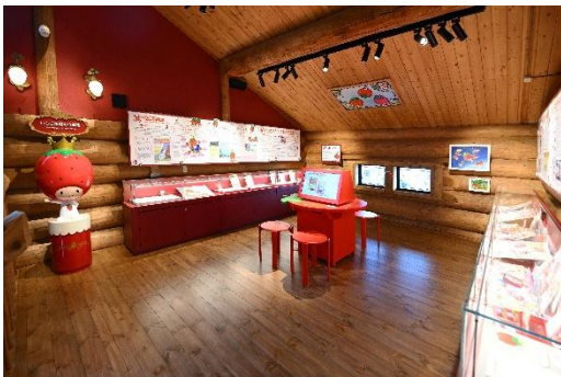
いちご新聞のお部屋