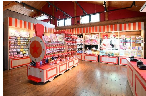
ミュージアムショップ