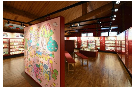
サンリオメモリーズ