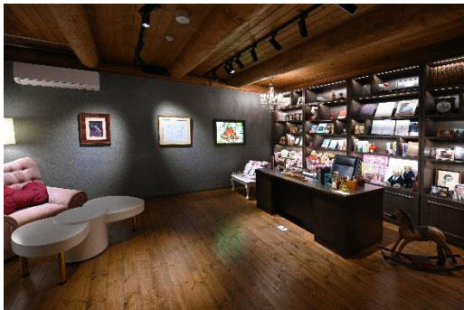
いちごの王さまのお部屋

辻信太郎が実際に使用していたデスクや椅子などゆかりの品とともに貴重資料を展示する「いちごの王さまのお部屋」など、辻信太郎個人の歴史に触れていただけます。