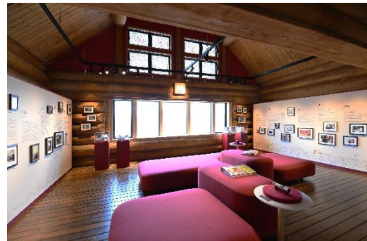
みんななかよくサロン