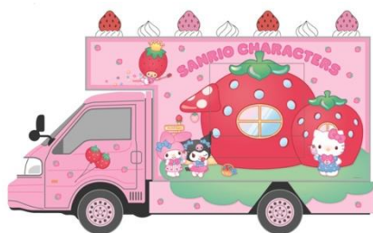
サンリオいちごのお家号