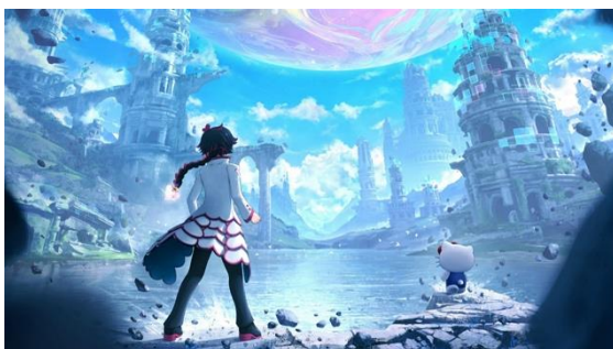
ロイハッピー編：Imagine Your Starlight

公式サイト： https://8puronicles.sanrio.co.jp 公式Xアカウント： https://x.com/8Puronicles