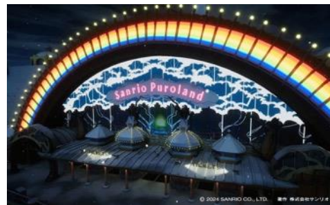
© 2024 SANRIO CO., LTD. 著作 株式会社サンリオ