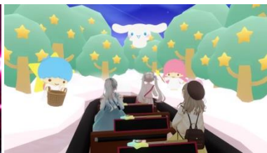
キャラクターと出会ったり、一緒に写真が撮影できるグリーティング