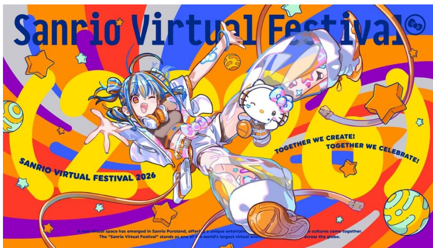
© 2026 SANRIO CO., LTD. 著作 株式会社サンリオ

本イベントは、2021年よりXR領域における新しいデジタル体験の提供を目的として始まり、過去4回の開催で総来場者数が1,000万※1を超えました。ソーシャルVRプラットフォーム「VRChat」上に2025年12月にオープンした“進化し続ける”常設型VRテーマパーク「Virtual Sanrio Puroland」にて開催されます。本イベント内ではオリジナルアバター(モチポリ)※2に着替え、好きなサンリオキャラクターの衣装やアイテムなどを自由に身につけて、まるで実在する「サンリオピューロランド」でイベントを体験しているかのような没入感を味わうことができます。「Virtual Sanrio Puroland」内に出現した巨大空間に、バーチャルアーティスト/クリエイター、他社IP、サンリオキャラクターたちが様々なパフォーマンスを披露するなど、サンリオキャラクターのファンからVRコアユーザーまでみんなで盛り上げられるイベントとなっております。