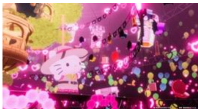
Musical Treasure Hunt