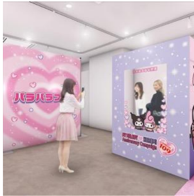
平成のプリントシール機風フォトスポット