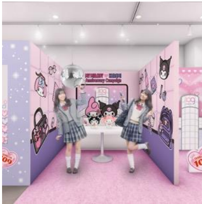
カラオケルーム風フォトスポット

マイメロディ、クロミと一緒にSHIBUYA109に遊びにきたような写真が撮れるフォトスポットのほか、カラオケルーム風のフォトスポット、平成のプリントシール機風のフォトスポットなど、“放課後、友達と渋谷で遊んで盛り上がる青春シーン”をイメージした3つのフォトスポットが登場します。