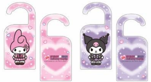
マイメロディ & クロミ オリジナルカラビナ ※画像はイメージです。