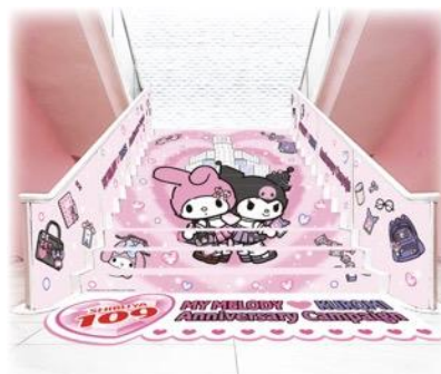
スペシャルデコレーション ※画像はイメージです。