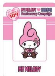
オリジナル学生証風カード