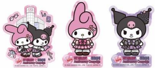
オリジナルステッカー ※画像はイメージです。