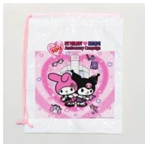
オリジナルショッパー

※ノベルティはなくなり次第終了です。※ノベルティはお1人様につき1点までです。※状況に応じて、入場規制・整理券配付を設ける場合がございます。