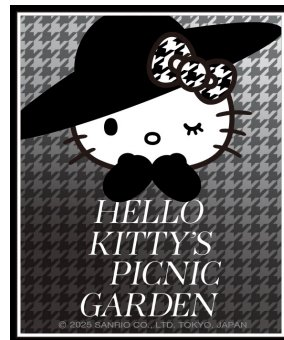
限定オリジナルステッカー デザイン