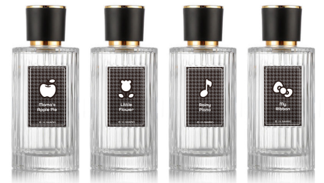
会場に展示する4種のフレグランスボトル ※上記はプレゼント用のミニボトルではございません。