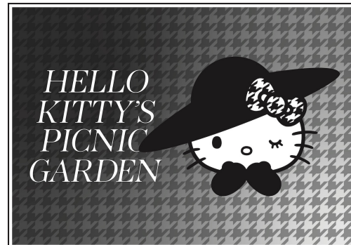
イベントキービジュアル

※本イベントは予告なく、中止、内容変更となる場合がございます。 ※当日は会場スタッフの案内に従ってご参加ください。