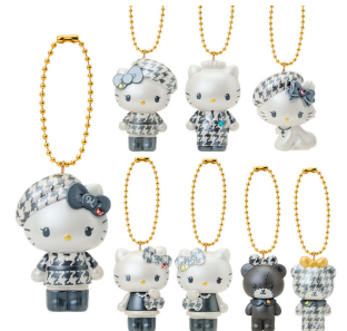
シークレットマスコットチャーム 各¥990(税込) ※ランダム1つ。中身を選ぶことはできません。