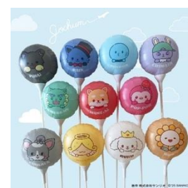
バルーンスティック(全11種)