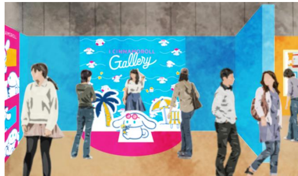
フォトスポットイメージ