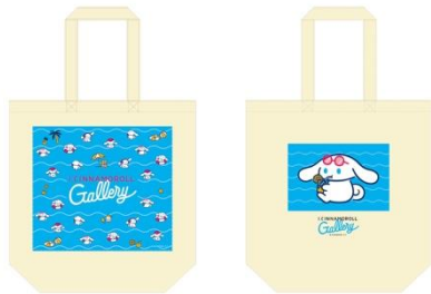
トートバッグ(全2アイテム) 3,300円