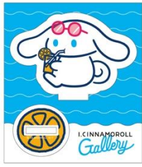
アクリルスタンド 880円

夏ののんびり過ごすアイシナモロールのデザインをメインとした、本ギャラリー限定販売のグッズラインアップは、アクリルスタンド、缶バッジ、ステッカー、トートバッグ、マグカップ、イラストカードの全21アイテムを展開します。物販コーナー出口には、ご自身の“ご自愛”方法について自由に語り、共有できるメッセージボードを設置予定です。