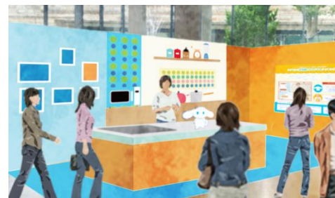
「ゆるドキ☆クッキング」コーナー

さらに、来場いただいた方へ、数量限定で特別デザインのうちわを配布予定です。見て、撮って楽しめる今夏限定開催のギャラリーをぜひお楽しみください。