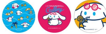
缶バッジ(全3アイテム) 各550円