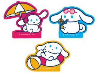
ステッカー(全3アイテム) 各550円