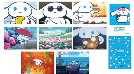
イラストカード(全10アイテム) 各275円