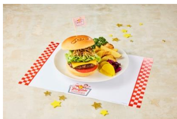
シナモンが夢でみた大きなきんぴらバーガー 2,300円