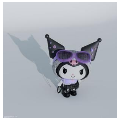
アーティスト写真

クロミは、誰もが自分史上最高の自分を目指す世界を作るため、「#世界クロミ化計画」を通じ、「あんたもなりたい自分になっちゃおうよ！」というメッセージを発信し続けてきました。「#世界クロミ化計画」の第1弾として発表した楽曲「Greedy Greedy」のミュージックビデオの再生回数が1,400万回超えを記録し、TikTokで公開中の「歌ってみた動画」でも歌唱力の高さが話題のクロミですが、今後音楽を通してさらにそのメッセージを広げるため、この度アーティストとして本格始動することとなりました。KUROMIのアーティストデビュー宣言を本日公開したほか、KUROMI初のアーティスト作品となる1st EP「KUROMI IN MY HEAD」を2025年10月22日(水)にリリースすることを発表しました。