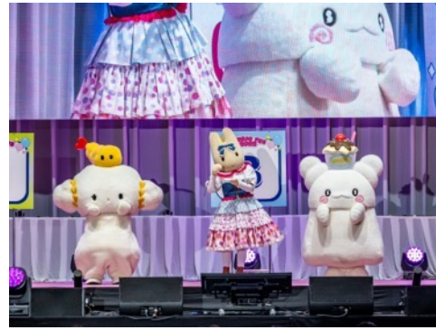
アニバーサリーステージでクイズに挑戦する「こぎみゆん」「マロンクリーム」「はなまるおばけ」