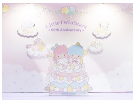
キキとララの願いの木の50周年フォトスポット