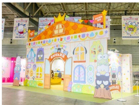
はびだんぶいのはびだん別荘