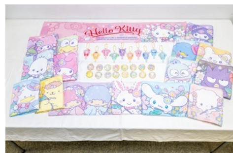
「SANRIO FES 2025」限定販売商品

※画像素材ご掲載の際は、必ずコピーライトの記載をお願いいたします。