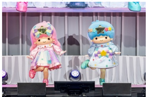
スペシャルライブで新曲をお披露目する「リトルツインスターズ」