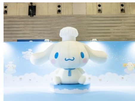
シェフシナモンといっしょ