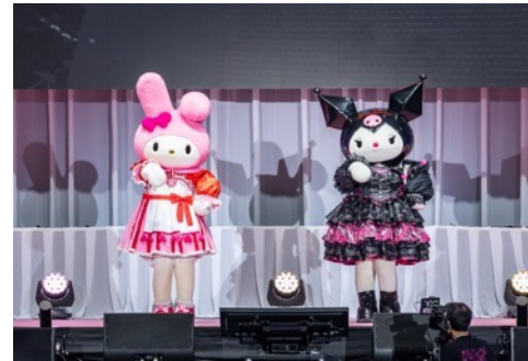
スペシャルライブで「Kawaii (Prod. Gen Hoshino)」の楽曲に合わせてダンスを初披露する「マイメロディ」「クロミ」