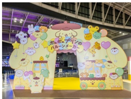
ポムポムプリンのパルーンメーカー