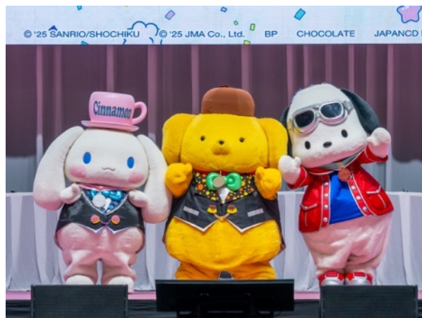
左から「シナモロール」「ポムポムプリン」「ポチャッコ」

TOP10の発表からはキャラクターたちが登場し、各順位が発表されるたびに、会場からは「キーン！」と悲鳴や歓声上がり、涙を拭うファン姿も。第3位は「ポチャッコ」、第2位には「シナモロール」の名前が呼ばれ、「シナモロール」は、「みんな、たくさん応援してくれて本当にありがとう。とっとうれしいな♪キミと一緒にどんな未来へも飛んでいけるよ。」とファンに感謝の気持ちを伝えました。そして、 9年ぶりに第1位に選ばれた「ポムポムプリン」 は、「わあ～い！ほんとに1位なの？やったあー！たくさんの応援、本当にありがとう。おいしいものをいっぱい用意して、みんなにお礼がしたいな～。のんびりマイペースなほくほくけど、これからもよろしくね♡」と、会場やオンラインで結果を見守るファンへメッセージを送りました。またパートナー部門では、第1位に輝いた「ラッピー×サンリオキャラクターズ」から「ラッピー」が登場し、「第1位に選んで頂いてありがとうございます！サンリオキャラクターズのみならずとコラボできて、とっても光栄です！」と喜びを素直に語りました。