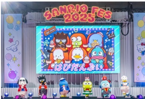
スペシャルライブでパフォーマンスをする「はびだんぶい」