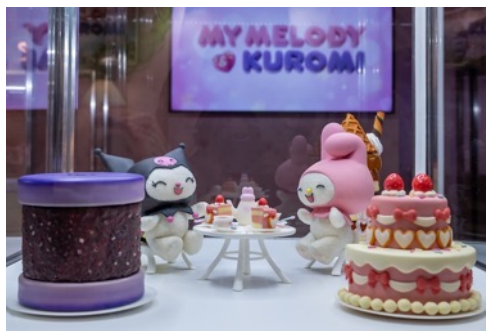
Netflixシリーズ「My Melody & Kuromi」のジオラマ展示