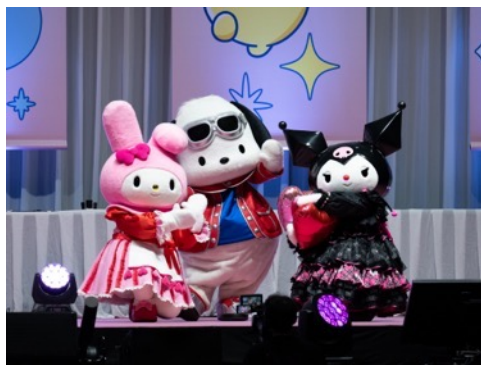
アニバーサリーステージでポーズを決める「マイメロディ」「ポチャッコ」「クロミ」