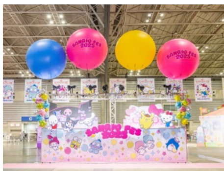
エントランスのモニュメント