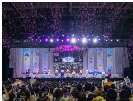
スペシャルライブのフィナーレで銀テープが舞う会場内

「SANRIO FES 2025」のアーカイブ見逃し配信はYouTubeでご覧いただけます。 https://www.youtube.com/live/V0VTgwdzyk8?si=Mk12pSQEFVKFPXFA