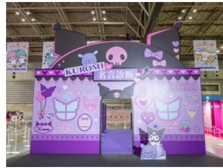
クロミの名言診断