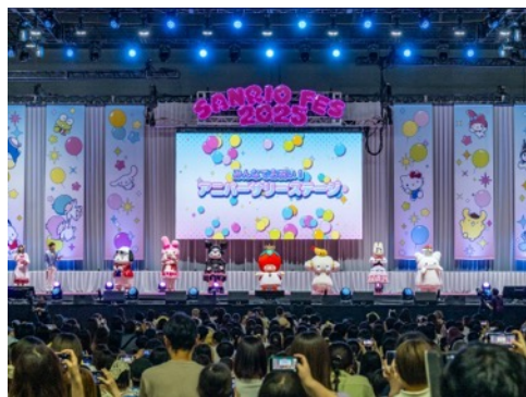
アニバーサリーを迎えたキャラクターたちを会場みんなでお祝い

「サンリオキャラクターズスペシャルライブ」では、「リトルツインスターズ」による新曲披露や、「はびだんぶい」や「マイメロディ」、「クロミ」のパフォーマンス、そして「ハローキティ」のピアノ演奏も。最後は2025年11月17日で上演を終了するサンリオピューロランドのパレード「Miracle Gift Parade」から「KAWAII FESTIVAL」をみんなでパフォーマンスし、幕を閉じました。