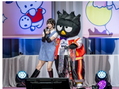
あのさんの肩に手を回す「バッドばつ丸」

スペシャルゲストとして登壇したあのさんは、直前まで行われていたサンリオキャラクター大賞の結果発表の様子を「歓声がとんでもなかったです、テンションが上がりました！」とコメントしました。ともにパートナー部門にエントリーした「バッドばつ丸」もサプライズでステージに登場し、あのさんは「ばつ丸に投票したよー！会えて嬉しいし、一緒にパートナー部門にエントリーできて楽しかったです！」とメッセージを送りました。「バッドばつ丸」の好きなところについても「いたずら好きであまのじゃくだけど、根は優しくて可愛い！」と笑顔で語り、「バッドばつ丸」もまんざらでもない様子。また、31年振りにTOP10入りを果たした「あひるのペックル」にも「おめでとう！すごいね、大ニュース！」とメッセージを送りました。