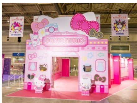
ハローキティとディアダニエルのフォトスタジオ