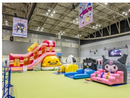
今年初登場となったキッズエリア