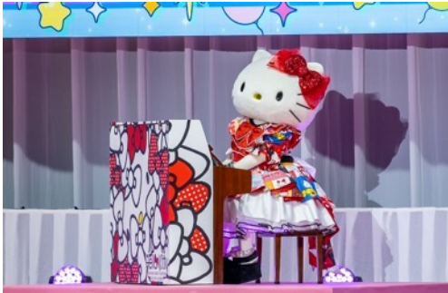
スペシャルライブでピアノを演奏する「ハローキティ」