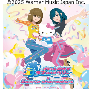
オシャレ魔女 ラブ and ベリー x ハローキティ (株式会社セガ) ©SEGA