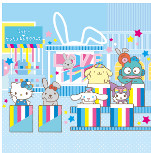
ラッピー×サンリオキャラクターズ (株式会社TBSテレビ,TBSグループ)