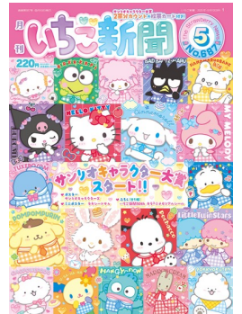
いちご新聞5月号 220円(税込)

詳細はこちら： https://ranking.sanrio.co.jp/others/