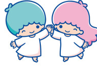
リトルツインスターズ (昨年10位)

おともだちのみなさん♡おうえん ありがとう♡またおともだちのみ なさんとここにこしたいな♡