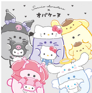
オバケ x サンリオキャラクターズ (株式会社クラックス) ©CRUX