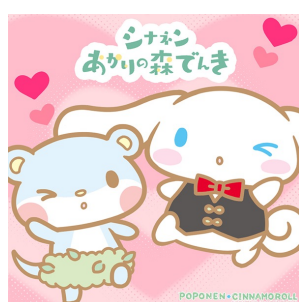
ポポネ×シナモロール (シナネ株式会社)