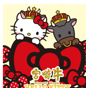
牛さん×ハローキティ (JA宮崎経済連)