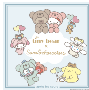
tiny bear×サンリオキャラクターズ (株式会社F.O.インターナショナル)