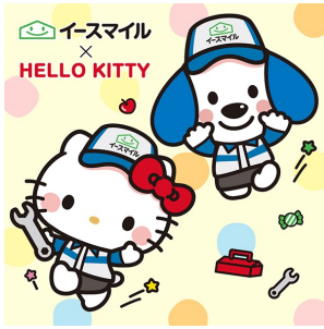
シューリーくん×ハローキティ (株式会社イスマイル)

企業や地方自治体などのキャラクターとサンリオキャラクターがパートナーを組んだ37組がエントリーする「2025年サンリオキャラクター大賞 パートナー部門」も同時開催します。