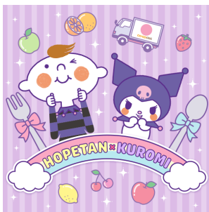
ほべたん×クロミ (コープデリ生活協同組合連合会) © CO-OPDELI CONSUMERS' CO-OPERATIVE UNION. All rights reserved.