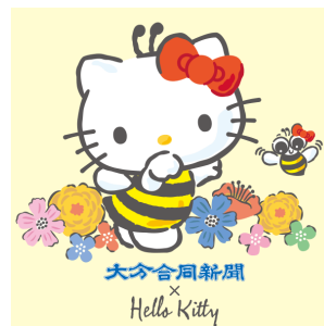
ぶんぶん×ハローキティ (大分合同新聞社)