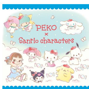
ペコちゃん×サンリオキャラクターズ (株式会社不二家) © FUJIYA CO.,LTD.