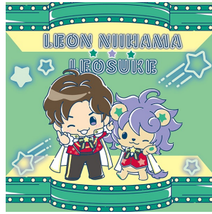
新浜レオン x れおすけ (株式会社B ZONE)