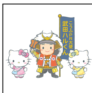
こうふPR大使武田ハルくん×ハローキティ (山梨県甲府市)