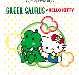
グリーンザウルス x ハローキティ (JA宮崎経済連)