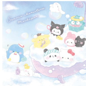
もちもちばんだ x サンリオキャラクターズ (株式会社ガミオジャパン) ©KAMIO JAPAN