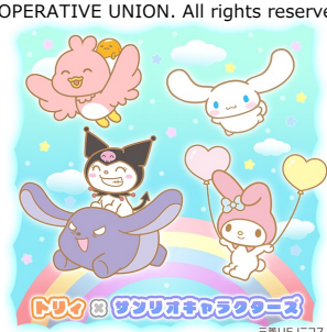
トリ×サンリオキャラクターズ (三菱UFJニコス株式会社) ©Mitsubishi UFJ NICOS