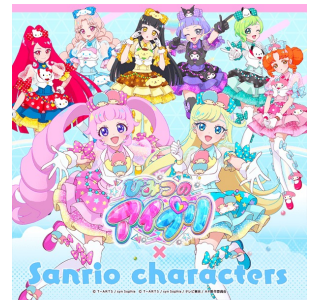
ひみつのアプリ x サンリオキャラクターズ (株式会社タカラトミーアーツ)