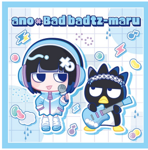
あの x バッドばつ丸 (株式会社トイズファクトリー)