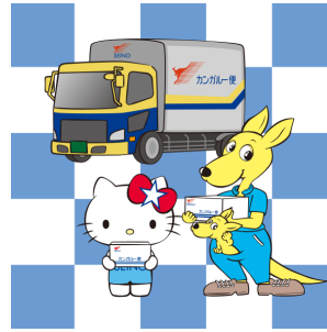
カルちゃん x ハローキティ (西濃運輸株式会社)

© 2025 SANRIO CO., LTD. APPROVAL NO. L656061