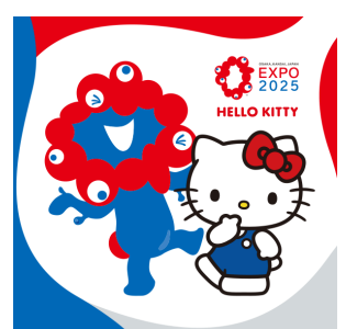
ミヤクミヤク x ハローキティ (公益社団法人 2025年日本国際博覧会協会) ©Expo 2025