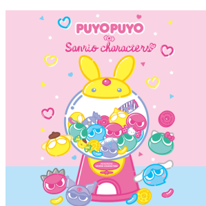
ぷよぷよ x サンリオキャラクターズ (株式会社セガ) ©SEGA