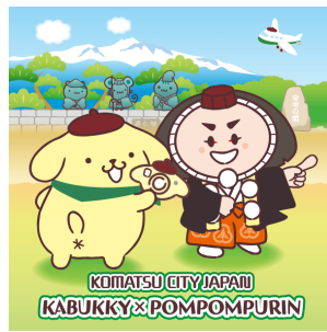
カブッキー×ポムポムプリン (石川県小松市)