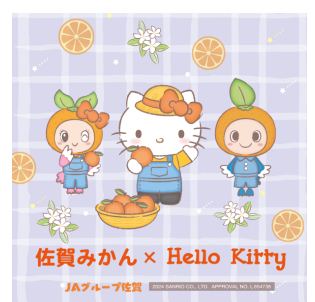
さがみかんきち・かんみ×ハローキティ (JAグループ佐賀)