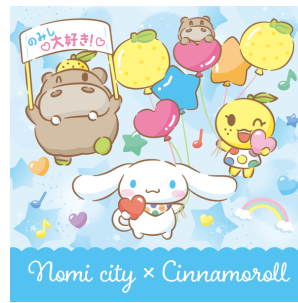
ひぼ能ん・ゆず美ん・ぼぼ能ん×シナモロール (石川県能美市)