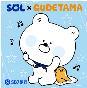
SOL x くでたま (株式会社SBJ銀行)