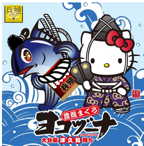
ヨコヅナ x ハローキティ (株式会社兵殖)