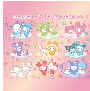
TWICE LOVELYS x サンリオキャラクターズ (株式会社ワーナーミュージック・ジャパン) ©JYP Entertainment. ©2025 Warner Music Japan Inc.