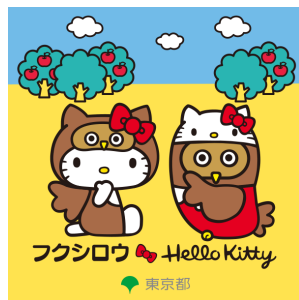
フクシロウ×ハローキティ (東京都福祉局)