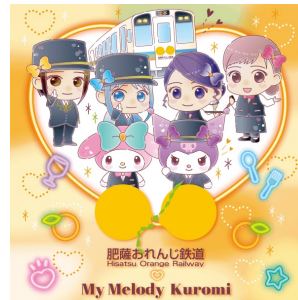
ディーゼルガールズ x マイメロディ & クロミ (肥薩おれんじ鉄道株式会社)