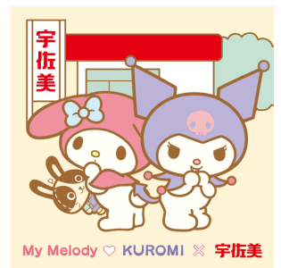
うさびい×マイメロディ&クロミ (株式会社宇佐美鉱油)