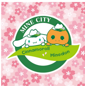
ミネドン×シナモロール (山口県美祿市)