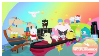
バーチャルボートライド