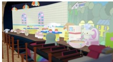
バーチャルボートライド乗り場