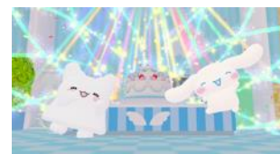
シナモロールとはなまるおばけの 「挑戦するみんなにエールを！」