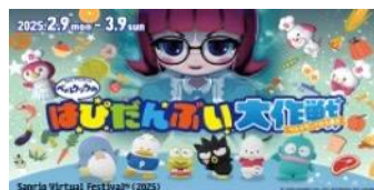
ベルクックのはびだんぐい大作戦 ベルクランドは大騒ぎ

『ベルクックのはびだんぐい大作戦 ベルクランドは大騒ぎ』『シナモロールとはなまるおばけの「挑戦するみんなにエールを！」』の2作品を上演いたします。このショーはそれぞれ、株式会社ベルク、株式会社NTTドコモの提供です。