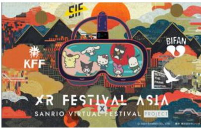
XR Festival Asia × Sanrio Virtual Festival Project

「Beyond the Frame Festival」推薦の「exxp」と、「Kaohsiung Film Festival」推薦の「TOKYO WAIYOZ」が、アーティストパフォーマンスにて出演/パフォーマンスを披露します。