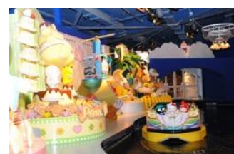
サンリオピューロランド アトラクション内