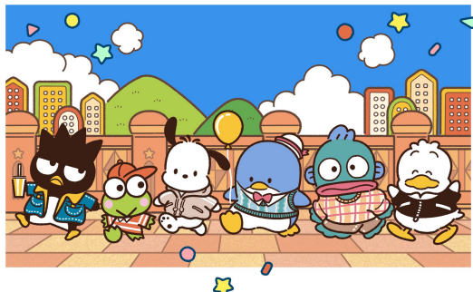
MV メインビジュアル (イラストレーター：サンレモ)

加えて、「はぴだんぶい」のメンバーであるハンギョドンは2025年に40周年を迎え、アニバーサリー記念デザインを中心に活動を展開していきます。