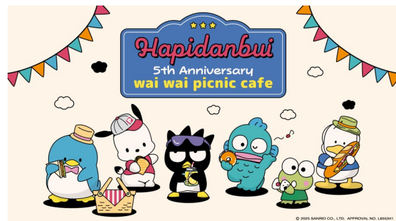
「はぴだんぶい わいわいピクニックカフェ」キービジュアル

また、カフェ限定で先行公開されるオリジナル動画を視聴することができ、オリジナルグッズの販売も行います。詳細は、カフェ公式サイトをご確認ください。