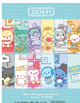
限定ステッカーデザイン

© 2024 SANRIO CO., LTD. APPROVAL NO. L655858