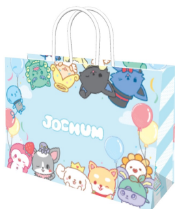
限定ショッパー(イメージ)