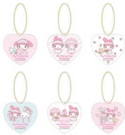
アクリルキーホルダー(ランダム6種) 770円