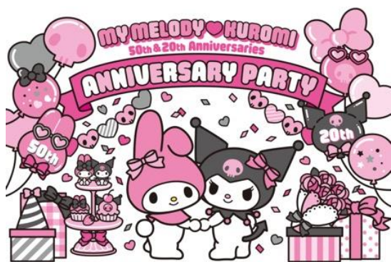
「MY MELODY♡KUROMI ANNIVERSARY PARTY」キービジュアル