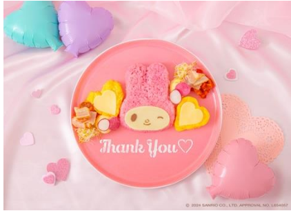
マイメロディのウェルカムオムライス♡ 1,690円