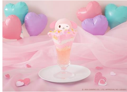
がんばったけどこぼれちゃった♡マイメロディ パフェ 1,490円