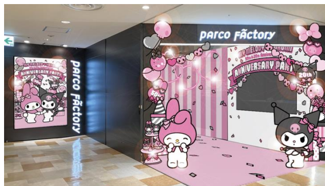
会場イメージ ※画像はイメージです。