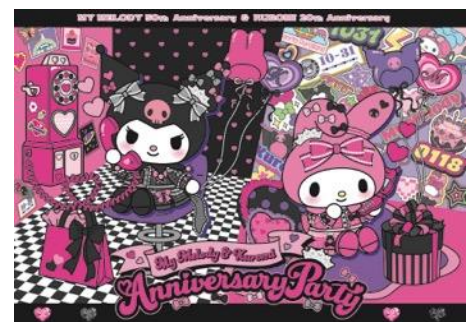
サンリオピューロランド キービジュアル

4階には、サンリオピューロランド初の体験型ショップ「My Melody & Kuromi Shop」がオープン。ふたりをイメージしたピンク×ブラックのカラーの「おそろい」モチーフが散りばめられた大人っぽい雰囲気的空間で、音や映像などインタラクティブな要素を盛り込んだ、マイメロディとクロミの世界に没入できるショップです。また、「おそろいバースデー」をイメージしたキュートでクールなおそろいの新コスチュームが登場します。スペシャルグリーティングやバースデーパーティなどでお披露目予定ですのでどうぞお楽しみに。他にも、グッズやフードメニューなども発売予定ですので、続報の発表をお待ちください。