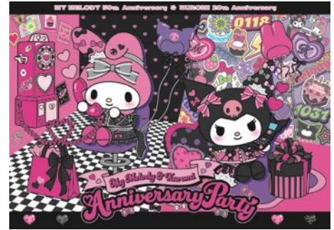
ハーモニーランド キービジュアル

ハーモニーランドでは、 マイメロディのピンクとクロミの黒を交換した、サンリオピューロランドと色違いの新コスチューム のマイメロディ・クロミとのグリーティングを実施するほか、園内のハッピーカフェを「マイメロディ & クロミ」仕様に装飾し、限定メニューなどを販売する「マイメロディ&クロミカフェ」として展開します。また、園内ショップでは、新コスチュームをイメージしたカチューシャやぬいぐるみなどの限定グッズも発売予定です。イベントの詳細は、12月中旬ごろよりハーモニーランド公式HPにて順次お知らせいたします。