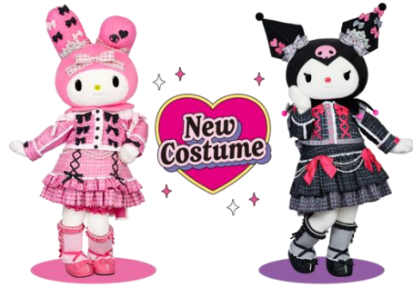
おそろいの新コスチューム