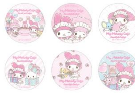
ホログラム缶バッジ(ランダム6種) 660円