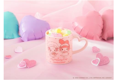
♡ましゅまるほっとみる♡ 990円