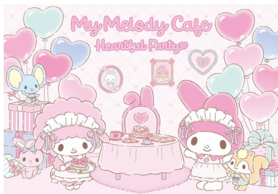
「My Melody Cafe ～Heartful Party～」キービジュアル

マイメロディ50周年を記念したテーマカフェ「My Melody Cafe ～Heartful Party～」の開催が決定しました。2024年12月12日(木)より東京にて、12月19日(木)より宮城にて、12月20日(金)より愛知にて、2025年1月17日(金)より大阪にて、期間限定でオープンいたします。メニューは全てマイメロディらしいピンクを基調とし「マイメロディからのありがとうの♡(ハート)を届ける」をテーマとしたスペシャル仕様で、ファンへの感謝の気持ちがこもったフォトジェニックなメニューとなっています。また、オリジナルデザインを使用したオリジナルグッズや特典なども登場します。詳細は、カフェ公式サイトをご確認ください。