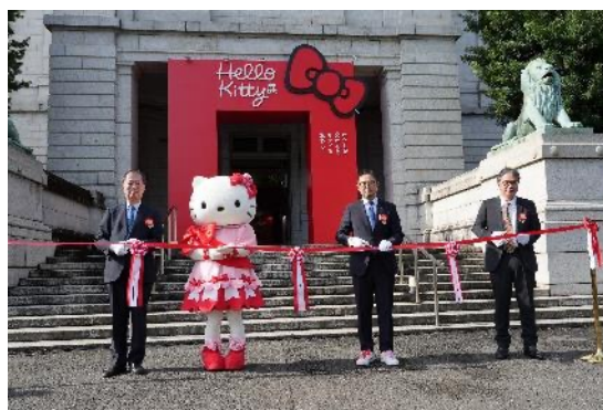
開会セレモニーでのテープカットの様子

展覧会の開催期間、東京国立博物館の「特別アンバサダー」に就任するハローキティは、スピーチの中で「東京国立博物館や、Hello Kitty展の魅力をみなさんにお伝えできるように」と抱負を語り、「家族やお友だち、恋人、大切な人と一緒に楽しんでもらえたら、とっても嬉しい」と翌々日から始まるHello Kitty展への想いを述べました。