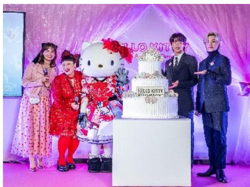
ハローキティ50周年を記念した特別なケーキで盛大にお祝い