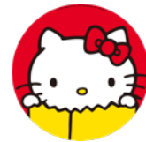
公式SNS プロフィール画像

【Instagram】 https://instagram.com/hellokitty_exh/