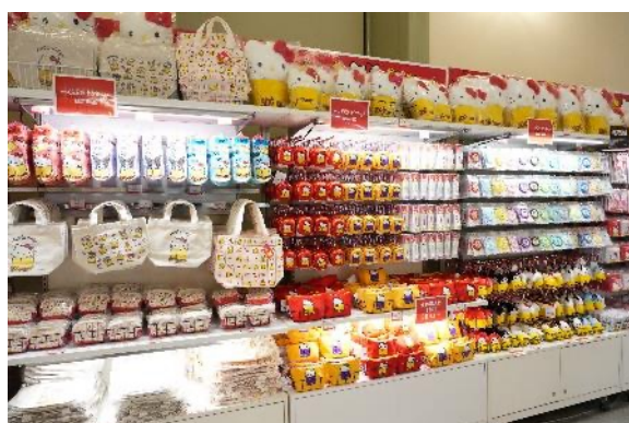
Hello Kitty展オリジナルグッズ