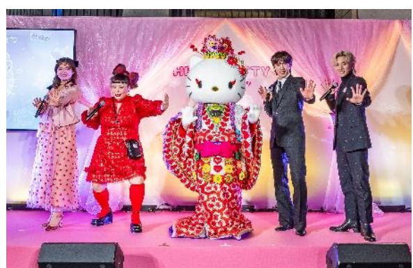
歌舞伎姿のハローキティとゲストのみなさんで見栄を切るフォトセッション