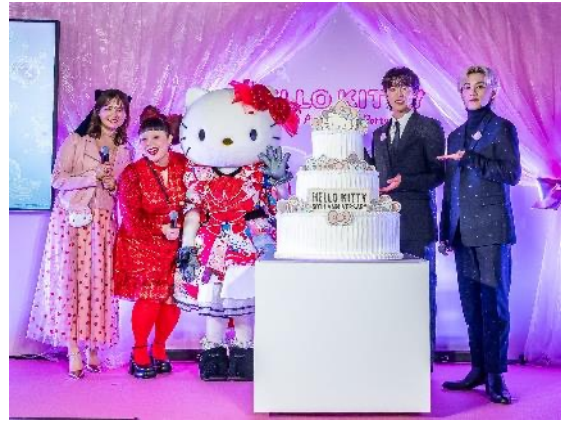
「HELLO KITTY 50th Anniversary Party」