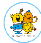
公式SNS プロフィール画像