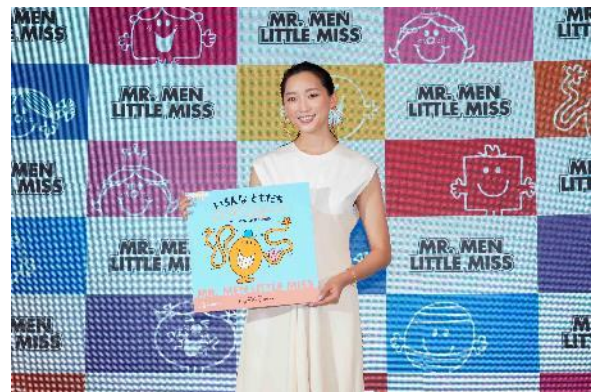
フォトセッションの様子