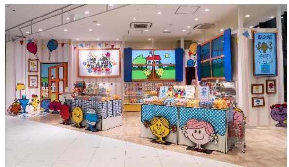
MR. MEN LITTLE MISS MARKET

https://shop.sanrio.co.jp/special/ilovemmen