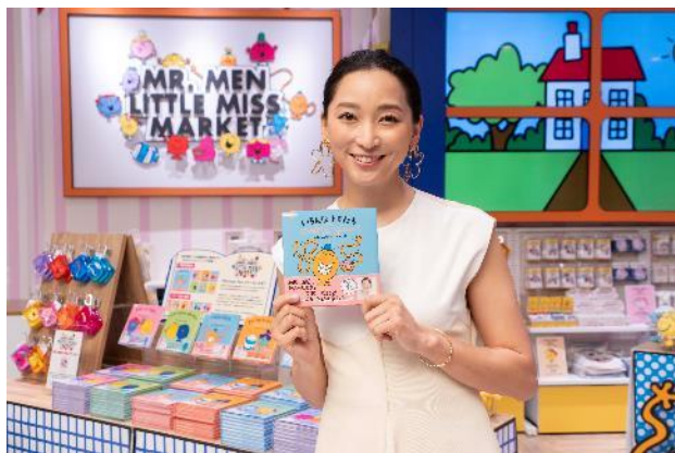
「MR. MEN LITTLE MISS MARKET」を 訪問する杏さん

また、杏さんと「MR. MEN LITTLE MISS」との出会いは、『お友だちからいただいたプレゼント』だと話し、『初めは私の見た目が「ミスタートール」という背の高いキャラクターに似ているからという理由で、お友だちが本をくれたんです』とキャラクターとの思い出を語りました。