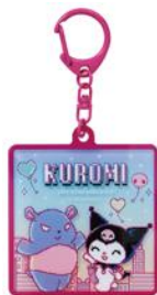
レイヤーアクリルキーホルダー 858円