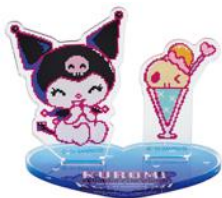
アクリルスタンド 1,100円