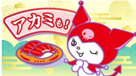
「#世界クロミ化WEEK2024」連動オリジナル動画