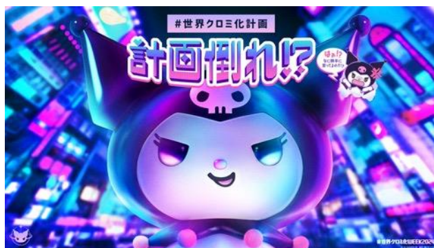
「#世界クロミ化WEEK2024」キービジュアル

10月4日(金)より、JR新宿駅東口の大型街頭ビジョン「クロス新宿ビジョン」でクロミ初の3D動画を放映するほか、10月5日(土)には新宿周辺で「#世界クロミ化計画」特別号外を配布します。また、スマートフォン上で無料で遊べる「#世界クロミ化計画」にちなんだゲーム2タイトルを順次公開し、ゲームに登場するピクセルアート風のイラストを使用したグッズを一部サンリオショップとキデイランドで発売いたします。他にも、東京・新宿と大阪・天王寺のサンリオショップの一部コーナーが期間限定で“クロミ化”し、「#世界クロミ化WEEK2024」特別装飾になったり、10月9日(水)からは全国の回転すし「スシロー」とのコラボ「#スシロークロミ化計画」がスタート。クロミが「#世界クロミ化計画」を続行しようと奮闘する「#世界クロミ化WEEK2024」をぜひお楽しみください。