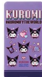
リチウムイオンポリマー充電器 4,708円