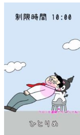
「アンタの背中全力で押してやるよ! byクロミ」