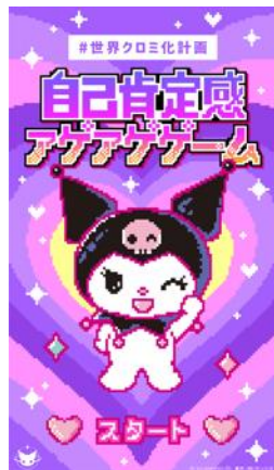
「自己肯定感アゲアゲゲーム」

10月4日(金)より、スマートフォン上で無料で遊べる「#世界クロミ化計画」にちなんだゲームを公開いたします。今回公開したのは、自己肯定感が“サゲサゲ”になってしまった人たちに、クロミのカチューシャをスワイプして届ける「自己肯定感アゲアゲゲーム」です。10月11日(金)からは、クロミが「自分に自信が持てない」と落ち込む人たちの背中を物理的に押しまくるゲーム「アンタの背中全力で押してやるよ! byクロミ」も公開いたします。