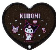
ハート型コンパクトミラー 1,650円