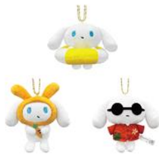
ぬいぐるみマスコット 各1,980円

<発売予定商品(一部)> ※価格は全て税込みです。 ※内容は予告なく変更する場合がございます。