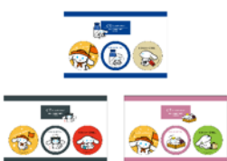
ご当地缶バッジセット 各1,100円