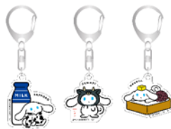
ご当地アクリルキーホルダー 各935円