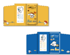
チケットフォルダ 各660円