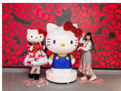
足元にリボンが集まってくるステップリボンスポット