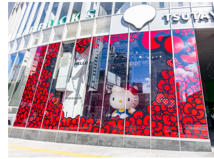
スクランブル交差点の先に現れるハローキティ