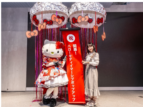
“リボン玉開き”で開幕をお祝い

また本イベントの目玉企画であり、ハローキティ史上最高の没入体験ができる「イマーシブスポット」の魅力をアピールするため、すずさんとハローキティが約3分間のTikTokライブ配信を実施。ハローキティの世界に溶け込める写真・動画の撮り方や映像の見どころなど、「イマーシブスポット」の楽しみ方を紹介しました。