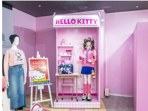
Hello Kitty展の展示を一部先行公開