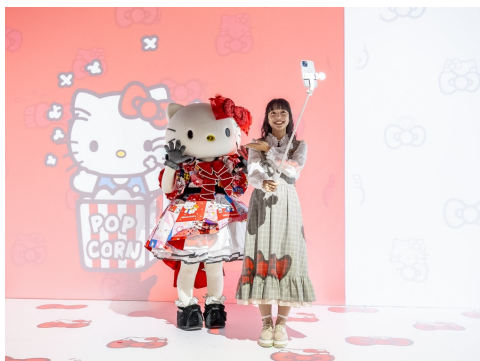
TikTokライブ配信で、イマーシブ空間の見どころを紹介