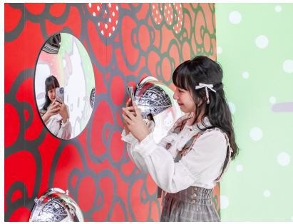
“鏡越しショット”が撮れるミラーフォトスポット