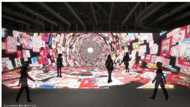
歴代のハローキティデザインに吸い込まれるオープニング