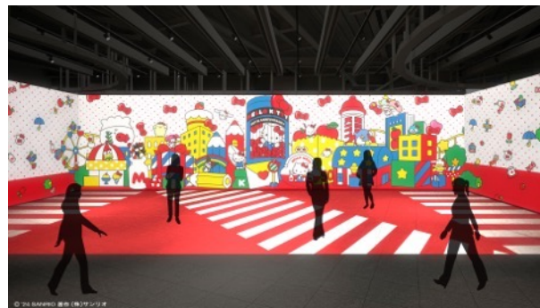
交差点の先に広がるハローキティの街へ！