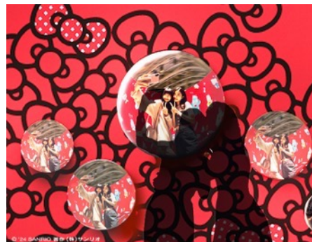
※画像はすべてイメージです