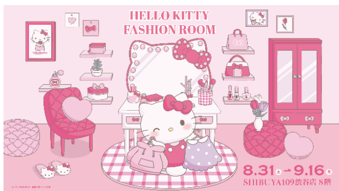
『HELLO KITTY FASHION ROOM』キービジュアル