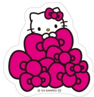
オリジナルステッカーデザイン

さらに開催期間中「HELLO KITTY FASHION ROOM」イベント会場内で撮影した写真や動画に、「#hellokitty50th」または「#ハローキティ50周年」を付けてご自身のSNSに投稿し、その画面を会場内のスタッフに見せると、オリジナルステッカーをプレゼントいたします。「HELLO KITTY IMMERSIVE POP-UP!」と色違いのオリジナルステッカーをぜひGETしてね！