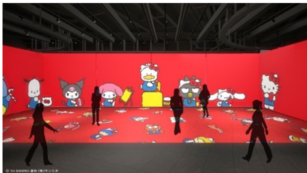
サンリオキャラクターズが登場しハローキティ50周年をお祝い