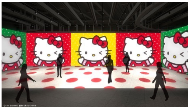
ハローキティが会場みんなにウインク