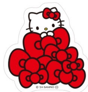
オリジナルステッカーデザイン

開催期間中に、「HELLO KITTY IMMERSIVE POP-UP!」イベント会場内で撮影した写真や動画に「#hellokitty50th」または「#ハローキティ50周年」を付けてご自身のSNSに投稿し、その画面を会場内のスタッフに見せると、限定オリジナルステッカーをプレゼントいたします。 ※ステッカーの配布は先着順で、なくなり次第終了となります。