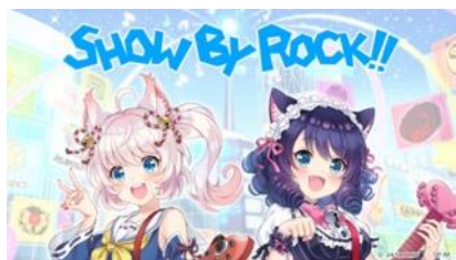
SHOW BY ROCK!!