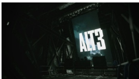
開催フロア B5 ALT3 Directed by 0b4k3