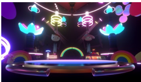
開催フロア B4 FUSION STAGEイメージ

バーチャルクリエイターパフォーマンスでは、個性豊かなクリエイターたちが、従来の枠にとらわれない自由なパフォーマンスを行います。空間を舞うパーティクルを生かした演出や、ゲーム性の高いインタラクティブな演出、サンリオキャラクターとのコラボレーションなど、バーチャル空間を最大限に生かしたパフォーマンスを体験できます。