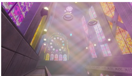
開催フロア B3 LUMINA STAGEイメージ

バーチャルアーティストパフォーマンスでは、多様なバーチャルアーティストが出演。サンリオキャラクターが刻まれたスタンドグラスがアーティストのパフォーマンスを鮮やかに彩り、光と音の演出で訪れた方々の心を魅了します。