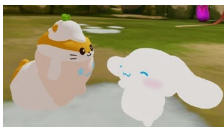
バーチャルグリーティングイメージ