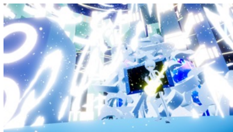
過去開催の様子(キヌ)