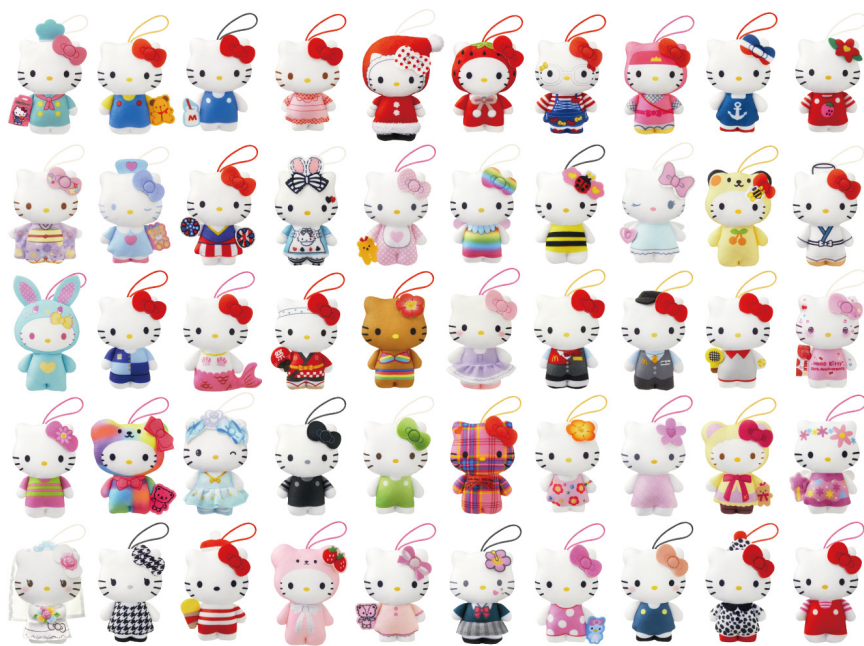
ハッピーセット「ハローキティ50周年」のおもちゃとして登場する 50種類のハローキティのストラップ付きぬいぐるみ

2024年に50周年を迎える「ハローキティ」とハッピーセットが、50周年を記念してコラボレーションし、全50種類のハローキティのストラップ付きぬいぐるみが登場します。本コラボ限定の4種、マクドナルドのユニフォームデザインや、50周年記念の特別仕様のデザインなどのぬいぐるみに加え、過去のハローキティのデザインの中から、モノトーンデザインの「しろ&くろ」、頭にハイビスカスをつけた「パール」、「ウェディングドレス」や「人魚」「いちご」など、ついコレクションしたくなる、懐かしさやかわいさがギュッと詰まったものを選び、ぬいぐるみにしました。