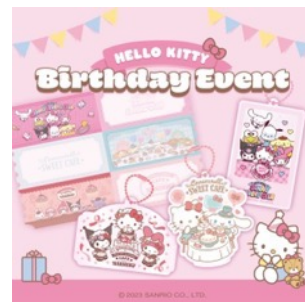
カフェのバースデーイベント