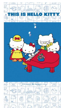
ハローキティ動画アカウント This is hello kitty.での投稿イメージ