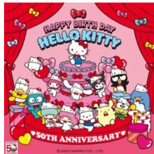
ポップアップストア キービジュアル

11月1日(水)から1ヶ月間、ハローキティ50周年を記念して、ソウルのサンリオキャラクターカフェ3店舗(Sanrio Lovers club、Cinnamoroll sweet café、Cafe harmony)が連動したキティのバースデーイベントを開催します。コースターなどのノベルティプレゼントや、3つのカフェをまわりスタンプを集めると、各店舗のデザインのキーリングがもらえるスタンプラリー企画を実施します。