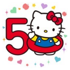
「いいね」すると、 現れるアニメーションイメージ