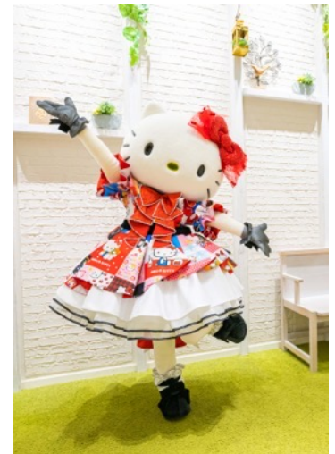
ハローキティ50周年記念新衣装

アイドル・タレント・アーティストの衣装制作・スタイリング・ヘアメイクなどを行うクリエイティブ企業。AKB48の結成時から衣装・ヘアメイクを手掛け、メンバーの個性を引き出す豊富な衣装デザインとバリエーションに定評がある。近年では、学校制服ブランド「O.C.S.D.」や医療制服ブランド「O.C.M.D.」、ゲームキャラクターの衣装デザインなど、多岐に渡り活動の幅を広げている。