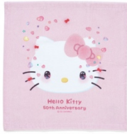
ハンドタオル 792 円