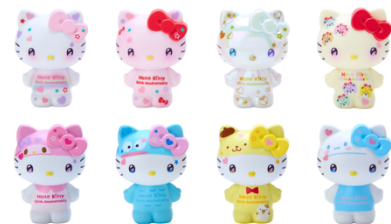
シークレットマスコット 990 円