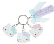
アクリルキーホルダー 1,100円