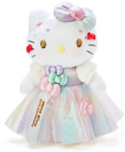
バースデール 16,500 円