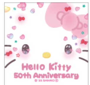
ステッカーデザイン

URL： https://www.sanrio.co.jp/news/shop/kt-50th-novelty-20231017/