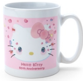
マグカップ 1,485 円