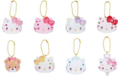
シークレットアクリルチャーム A (全 8 種) 各 693 円