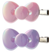
前髪クリップ 693 円