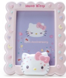
フォトフレーム 3,960 円