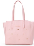
トートバッグ 6,380 円