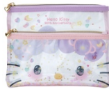
フラットポーチ 1,980 円