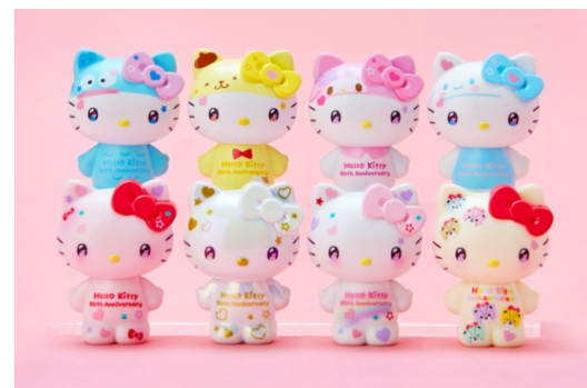
シークレットマスコット

毎年ハローキティのバースデーに発売している特別仕様のバースデードールは、今回のデザイン「The Future In Our Eyes」のコスチュームで、左足にはシリアルナンバーが入ります。ぬいぐるみやマスコットホルダーも同デザインのコスチュームを身につけ、マスコットホルダーにはハローキティの双子の妹ミミもラインナップしています。持ち歩いて楽しめる商品としては、バッグやポーチ、キーコインケースをはじめ、スマホを斜め