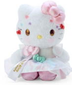
ぬいぐるみ 5,500 円