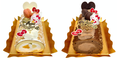
「堂島ロール バニラ」「堂島ロール ショコラ」各 4,800円(予価/税込み)

https://www.sanrio.co.jp/special/sanriocafe/