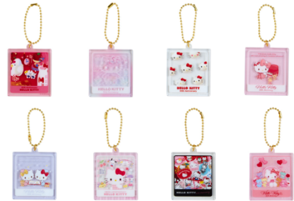
シークレットアクリルチャーム B (全 8 種) 各 693 円