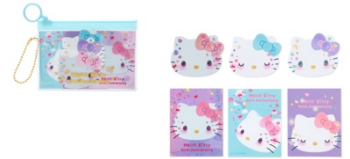
ステッカーセット 660 円