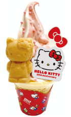
ハローキティ 50th ソフト ※イメージ

「Hello Kitty Japan ダイバーシティ東京 プラザ店」内「HELLO KITTY のこんがりやき」では11月1日(水)より、「ハローキティ 50th ソフト 500円(税込み)」を販売します。