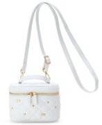
ショルダーバッグ 5,280 円