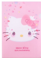
クリアファイル 594 円