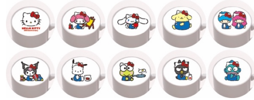
ハローキティ 50th ラテアート (全10種) ※イメージ