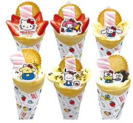
ハローキティ 50th クレープ (全10種) ※イメージ

https://www.sanrio.co.jp/special/sanriocafe/access.html