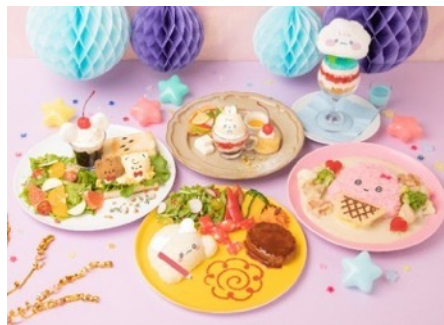
カフェメニュー例