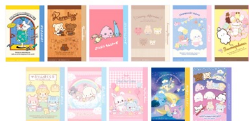
ブロマイドデザイン