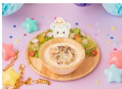
HopHop Babies あひるのかあさんのチーズリゾット 1,760円