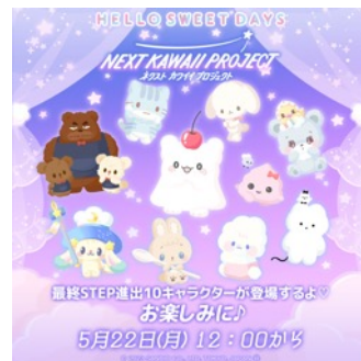
アプリ「ハロースイートデイズ」