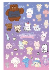
オリジナルステッカー

メニューをご注文いただいた方に「オリジナルステッカー(全1種)」をプレゼントいたします。