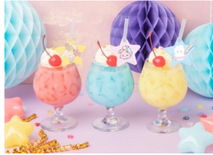
カラーフロート 990円