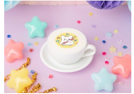
ほっとカフェラテ 880円