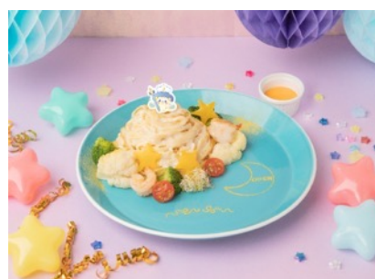
月の裏のレストラン すってんルセットの三日月パスタ 1,760円