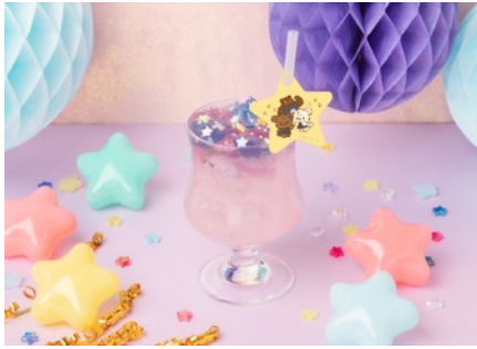
アフターパーティドリンク 990円