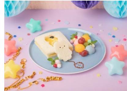
Fuwaranpukaran ふわらら〜ん♪なフルーツサンド 1,430円