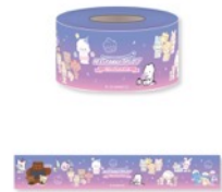
マスキングテープ 880円