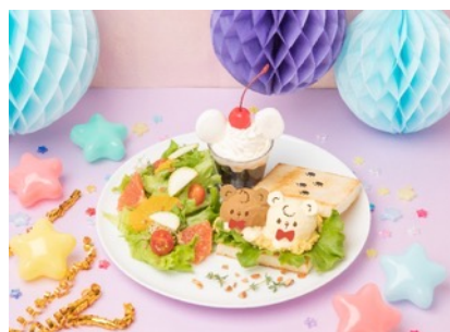
Kumalino とある森のカフェのオープンサンド 1,760円