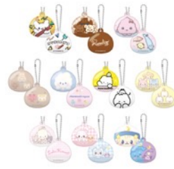
marshmallowキーホルダー(全10種) 990円