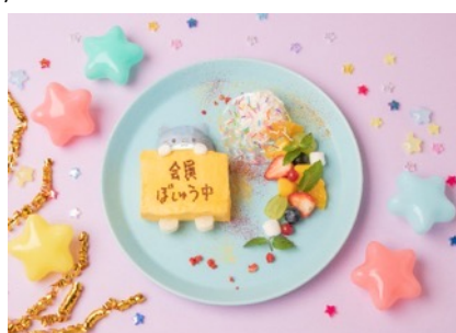
かぶりんぼくらぶ 会員になってくだサンド 1,430円