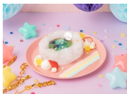
Lulu Kurun エンジェランドのふしぎないずみタルト 1,430円