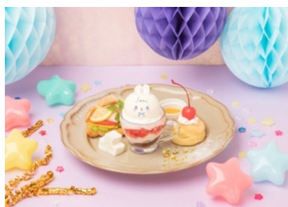
Creamy Afternoon チルチルとんぴりアフタヌーンティー はれのちにゆあ にゆあのみあふあ空色パフェ 1,760円