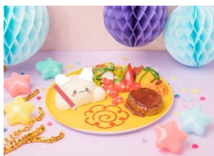
はなまるおばけ はなまるキッチンプレート 1,760円