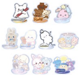
ミニアクリルスタンド(全10種) 880円

<オリジナルグッズ> ※価格は全て税込です。※缶バッジはおひとり様30個まで、その他はおひとり様各3個までの個数制限がございます。