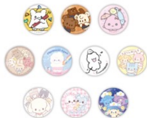
缶バッジ(ランダム10種) 605円