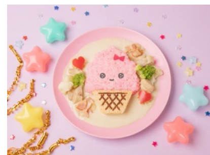
ぷりぷりうんぴ〜ず 名物ぷりぷりカレー 1,760円