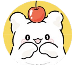
「はなまるおばけ」 公式Twitterアイコン