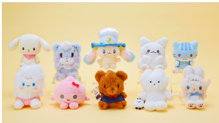
マスコットホルダー

「STEP3：グッズ投票」で発売するのは、「マスコットホルダー」「メモ」「A4クリアファイル」の3アイテム。応援したいキャラクターのアイテムを購入することで投票できるほか、これまで同様投票サイトからも1日1キャラクターにつき1票まで投票することができます。