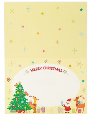
当日使用予定カード（※イメージです）