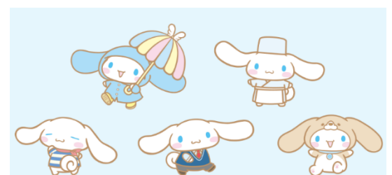
「好きに隠れる。シナモン」イメージ