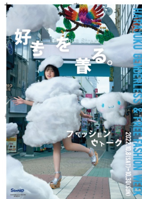
竹下通り掲出フラッグ