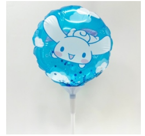
オリジナルスティックバルーン

※原宿エリアのコラボ実施店舗のみ、各ブランド他店舗やオンラインショップでの配布はございません。ご了承ください。