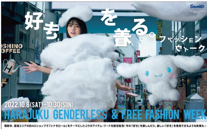
CUTE CUBE HARAJUKU 掲出ポスター

イベント期間中、原宿竹下通りではフラッグ、横断幕、「CUTE CUBE HARAJUKU」の壁面にイベントキービジュアルを掲出、JR原宿駅竹下口入口アーチにシナモンの巨大バルーンが登場します！また、シナモンからのメッセージも竹下通りで聴けるので耳でも楽しむ事ができます。