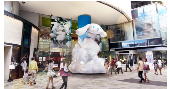
ラフォーレ原宿 入り口イメージ

『好きを着る。ファッションウィーク』開催に合わせて、原宿の街がシナモン尽くしに。ラフォーレ原宿の入り口にも巨大なシナモンのオブジェが登場するほか、竹下通りにバルーンやフラッグの掲出。さらに、「好きに隠れる。シナモン」と題し、原宿の街の中に、お気に入りのファッションを身にまとい隠れたシナモンを探す回遊イベントも開催。ほかにも、竹下通りにあるサンリオの直営店舗「sanrio vivitix HARAJUKU」もイベント開催期間中、シナモロール 20周年記念ショップへと変身するほか、10月23日(日)には、シナモンも原宿の街に遊びにやってきます。