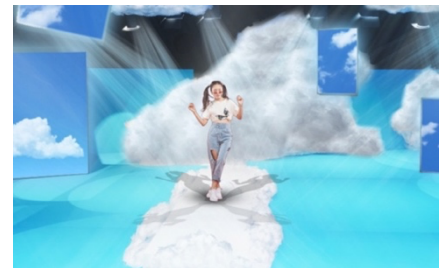
ランウェイスナップ イメージ

ファッションショー“そらんウェイ”終了後、実際にファッションショーで使用したランウェイの上でモデル風カットが撮影でき、さらに、ショーに出演したシナモンと一緒に写真撮影ができるイベントも実施いたします。完全予約制のため、申し込み等の詳しい情報は「好きを着る。ファッションウィーク公式サイト」をご覧ください。