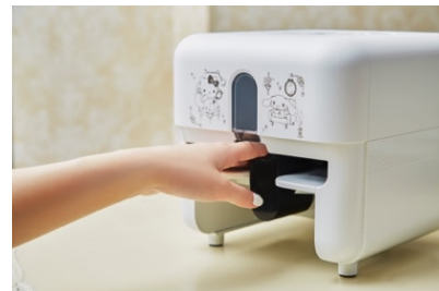
ネイルプリンター イメージ

※スタッフによる施術はございません。ベースコート、プレプリントコート、トップコートはお客様ご自身で塗っていただきます。 ネイルプリンターの操作はスタッフがサポートいたします。