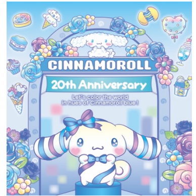
フォトスポットイメージ

※期間中店舗でのお取り扱い商品は、シナモロールグッズ、エンジョイアイドルシリーズに限らせていただきます。ご希望の商品のお取り寄せ等はできかねますのでご了承ください。