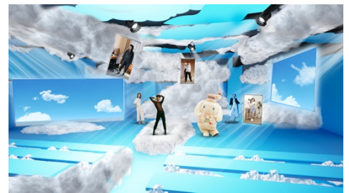
そらんウェイ イメージ

配信詳細については、『好きを着る。ファッションウィーク』公式サイトや公式 SNS をご確認ください。