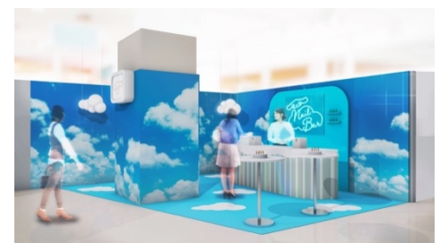
そらルーム イメージ

ラフォーレ原宿2Fでは、フォトジェニックなお空をイメージした空間“そらルーム”を期間限定でオープン。まるで空の上に立っているような写真を撮影して楽しめるほか、カシオ計算機のネイルプリンターで新たな好きと出会えるネイルプリント体験ができます。イベント限定のネイルデザインのため、この期間この場所でしか楽しめない限定感を楽しめます。