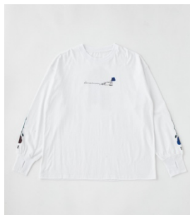
Adorozatorumary O2LONG TEE 8,250円