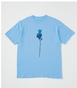
Adorozatorumary OS TEE 6,050円