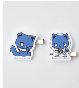
Adorozatorumary 前髪クリップ 1,650円 (左右2個入りセット)