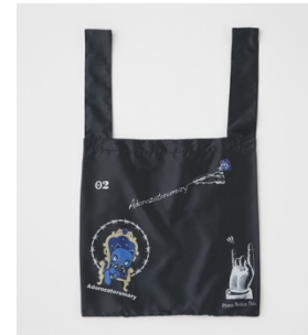
Adorozatorumary marché BAG 2,750円