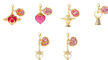
劇場版「美少女戦士セーラームーン Eternal」×サンリオキャラクターズ シークレットチャーム (全6種) 880 円 ※ブラインドボックス入りの販売のため、中身は選べません。