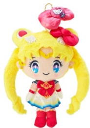
劇場版「美少女戦士セーラームーン Eternal」×ハローキティ スーパーセーラームーンマスコットホルダー 3,300 円