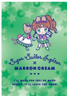
スーパーセーラージュピター×マロンクリーム

火星を守護に持つ戦いの戦士 スーパーセーラーマーズとクロミは、カッコイイ雰囲気とってもお似合いのペア。クールだけど夢に向かって頑張る二人は、熱いハートも持っているよ！