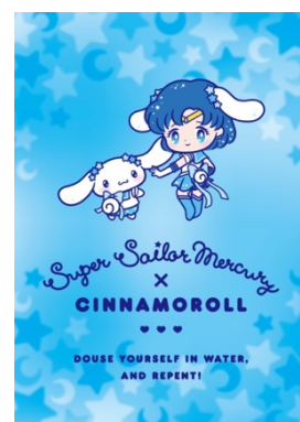
スーパーセーラーマーキュリー×シナモロール

愛と正義のセーラー服美少女戦士スーパーセーラームーンと、明るくて思いやりの心を持ったハローキティのペアはみんなに「愛」をお届けします。お揃いのコスチュームとリボンにも注目！