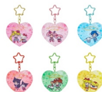
劇場版「美少女戦士セーラームーン Eternal」×サンリオキャラクターズ アクリルキーホルダー (全6種) 各 792 円 キャラクターラインアップ : ハローキティ、マイメロディ、 シナモロール、クロミ、マロンクリーム、ポムポムプリン