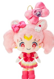
劇場版「美少女戦士セーラームーン Eternal」×マイメロディ スーパーセーラーちびムーンマスコットホルダー 3,300 円