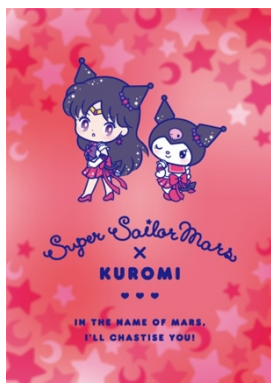
スーパーセーラーマーズ×クロミ

火星を守護に持つ戦いの戦士 スーパーセーラーマーズとクロミは、カッコイイ雰囲気とってもお似合いのペア。クールだけど夢に向かって頑張る二人は、熱いハートも持っているよ！