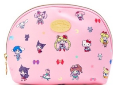
劇場版「美少女戦士セーラームーン Eternal」×サンリオキャラクターズ ポーチ 1,980 円