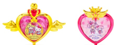
劇場版「美少女戦士セーラームーン Eternal」×サンリオキャラクターズ コンパクト型ミラー (全2種) 各 2,750 円