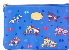
劇場版「美少女戦士セーラームーン Eternal」×サンリオキャラクターズ フラットポーチ 1,485 円