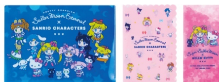
劇場版「美少女戦士セーラームーン Eternal」×サンリオキャラクターズ クリアファイルセット 594 円