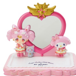
劇場版「美少女戦士セーラームーン Eternal」×マイメロディ ミラー付きトレイ 5,940円