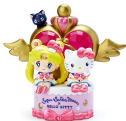
劇場版「美少女戦士セーラームーン Eternal」×ハローキティ ルームライト 6,930円