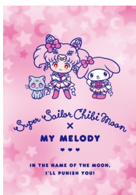
スーパーちびムーン×マイメロディ