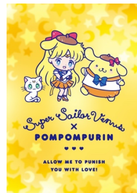
スーパーセーラーヴィーナス×ポムポムプリン

木星を守護に持つ保護の戦士 スーパーセーラージュピターとマロンクリームは、お料理好きでお花を育てるのも大好き。お揃いのお花飾りは二人の好みにピッタリ。