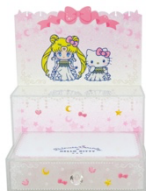
劇場版「美少女戦士セーラームーン Eternal」×ハローキティ アクセサリースタンド 4,400 円