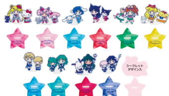
劇場版「美少女戦士セーラームーン Eternal」×サンリオキャラクターズ シークレットアクリルスタンド (全11種) 各 693 円 ※ブラインドボックス入りの販売のため、中身は選べません。