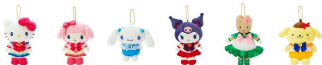
劇場版「美少女戦士セーラームーン Eternal」×サンリオキャラクターズ マスコットホルダー (全6種) 各 2,750 円 キャラクターラインアップ : ハローキティ、マイメロディ、シナモロール、クロミ、 マロンクリーム、ポムポムプリン