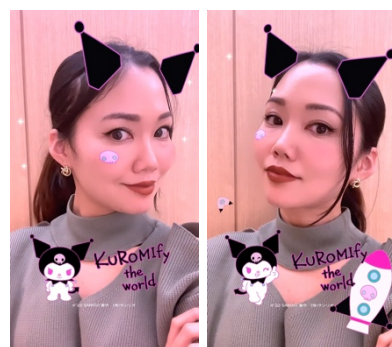
AR フィルターイメージ