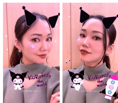
AR フィルターイメージ

クロミの Instagram アカウント (@kuromi_project) を AR 対応のスマホで開き、フィードの上のマークをタップし、AR フィルターを選択。 試すボタンから AR フィルターを起動し、撮影ができます。