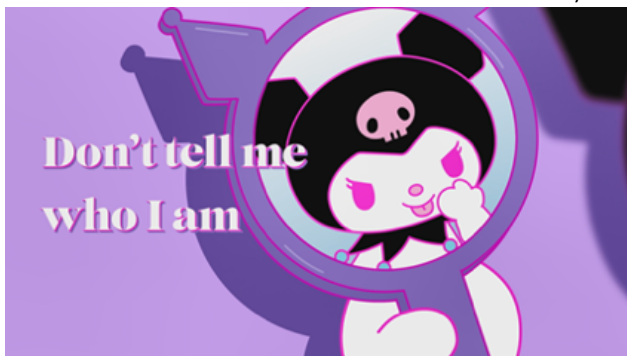
『Greedy Greedy English ver.』