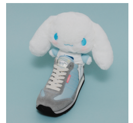
▲コラボレーションモデル「シナモロール M SAX」とぬいぐるみ

さらに、今回のためにパトリックのスニーカーを履いたシナモンのコラボデザインを新たに描きおこしました。このデザインを使用したアクリルキーリングやぬいぐるみ、アクリルクリップ、アクリルスタンド、チャームセットをライセンス各社から発売いたします。3月4日（金）に一部サンリオショップ、サンリオオンラインショップにて先行発売します。今後もコラボデザインを使用したライセンス商品を発売予定です。