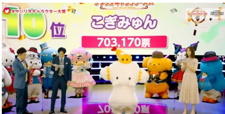
初のTOP10入りを果たしたこぎみゆん