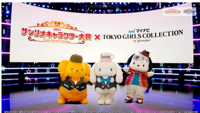
TOP3に輝いた、ポムポムプリン、シナモロール、ポチャッコ

速報・中間発表で1位と2位が入り替わるなど、波乱の展開で最後までファンをドキドキさせ続けた「2021年サンリオキャラクター大賞」。2時間の配信の最後の演目となったTOP10キャラクターの発表では、各順位のキャラクターの名前が呼ばれるたびに、各オンライン配信上の視聴者から「おめでとう！よく頑張った！」、「嬉しすぎて言葉にできない！」など、熱いコメントが寄せられました。第3位には「ポチャッコ」、第2位は今年25周年を迎えた「ポムポムプリン」の名前が呼ばれ、ステージの上から、応援してくれたみんなへの思い思いのメッセージを伝えました。中間発表2位から見事な逆転劇を見せ第1位に輝いた「シナモロール」は、「みんなにもらったたくさんの応援の気持ちに応えられるように、ぼくいろんなことに挑戦していくからね！これからもキミとずっと一緒だよ！」と興奮気味に話しました。