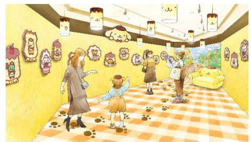
にこにこプリンルーム(イメージ)

また、ポムポムプリンを1分間独占出来る「ポムポムプリン 25周年スペシャルグリーティング(有料)」も「にこにこプリンルーム」にて期間限定で実施。ポムポムプリンでいっぱいの空間で、ポムポムプリンとの時間をお過ごしいただけます。