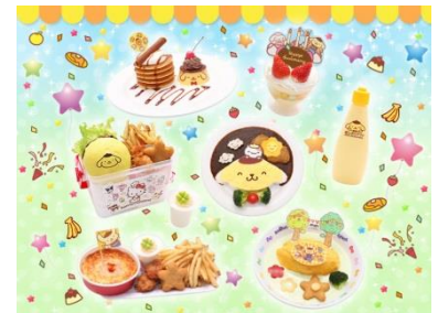
限定フード&スイーツメニュー(イメージ)

他にも、おともだちキャラクターも“にこにこ”なオムライスや、食べながらの記念撮影にもぴったりな飲むプリン、パンケーキが5枚積み重なったパンケーキタワープレートなど、様々なフード&スイーツメニューが登場します。ポムポムプリンの世界観を感じられるかわいいメニューをお楽しみください。