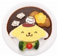
にこにこプリンのロスカツカレー ¥1,400