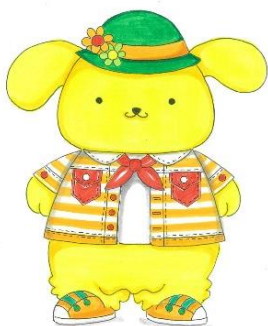
新コスチューム (イメージ)

大分県日出町のサンリオキャラクターパーク ハーモニーランド(以下、ハーモニーランド)でも、2021年4月1日(木)~12月31日(金)の期間、「元気いっぱい! のびのび! プリン」をテーマに、ポムポムプリン 25周年アニバーサリーイベントを開催いたします。