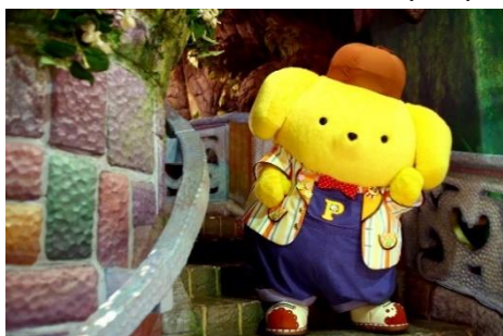
左：アニバーサリーを記念した新コスチューム

※「ポムポムプリン 25周年スペシャルグリーティング(有料)」の詳細は決まり次第、サンリオピューロランドのホームページでお知らせします。