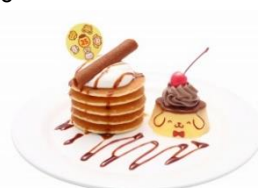
プリンのパンケーキタワープレート ¥1,000