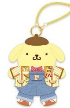
マスコット(発売日未定) ¥2,750 ※画像はイメージです