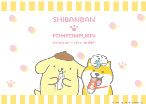
サンリオ描き下ろしデザイン いたずら（一部）

SNSを中心に人気のキャラクター「しばんばん」の5周年と、ポムポムプリン25周年を記念して、コラボレーションが決定！しばんばん作者オオゴシヤステルによる描き下ろしデザインに加え、サンリオでも3種類のデザインを描き下ろしました。癒し系犬キャラクターという共通点を持つしばんばんとポムポムプリン。ポムポムプリン公式 Twitter でも、明日1月19日(火)の投稿を皮切りに、みんなでのんびり仲良く過ごす様子を随時展開予定です。