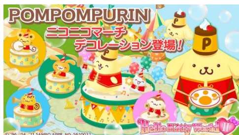
ニコニコマーチデザイン連動アイテム(一部)

さらに、箱庭ゲームアプリ『ハローキティワールド2』では商品発売に合わせて4月に、期間限定でポムポムプリン「ニコニコマーチデザイン」シリーズとの連動企画を実施します。実際に発売される商品が、箱庭を装飾するアイテムとなって登場!リアルグッズだけでなく、ゲームアプリ内でも、記念デザインのグッズを集めて楽しむことができます。