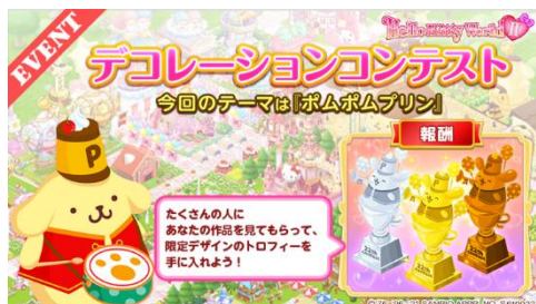
ハローキティワールド2 デコレーションコンテスト

さらに、箱庭ゲームアプリ『ハローキティワールド2』では商品発売に合わせて4月に、期間限定でポムポムプリン「ニコニコマーチデザイン」シリーズとの連動企画を実施します。実際に発売される商品が、箱庭を装飾するアイテムとなって登場!リアルグッズだけでなく、ゲームアプリ内でも、記念デザインのグッズを集めて楽しむことができます。