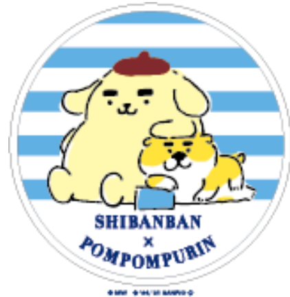
オオゴシヤステル描き下ろしデザイン（一部）