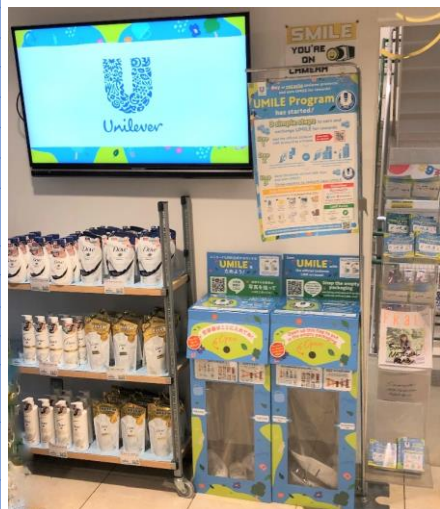
ナショナル麻布での展開例 近隣にお住まいの外国人の方向けに、回収ボックスの表示やリーフレット、紹介動画を英語でも提供しています。