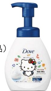
ダヴ 泡ハンドウォッシュ ハローキティ限定デザインボトル