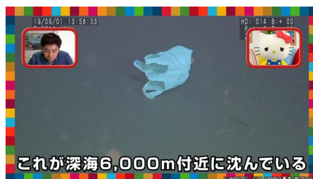
深海に沈んでいるレジ袋を見て、驚くハローキティ

画像素材ダウンロード ▶ http://prt.red/0/kittykankyo