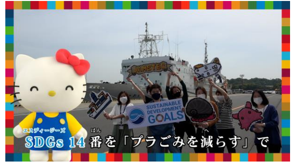
「海の豊かさを守ろう」をテーマに一緒に歌って踊るハローキティとJAMSTECの研究チームのみなさん