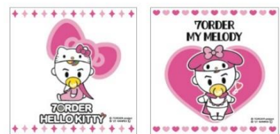
ステッカーのイメージ画像（一例）