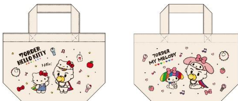
ランチバッグ（全2種） 各1,650円