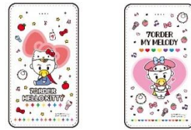
モバイルバッテリー（全2種） 各3,850円