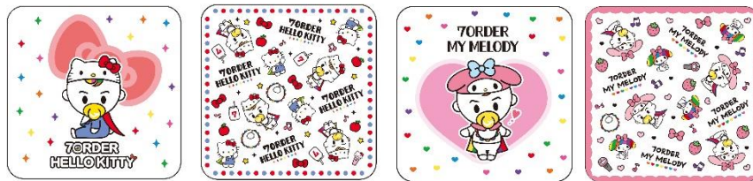
ミニアルバム（全4種） 各880円