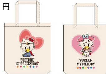
トートバッグ（全2種） 各2,200円