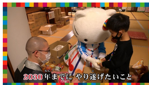
活動をお手伝いするキティ