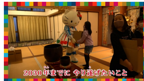
仕分けした段ボールと一緒に運ぶキティ