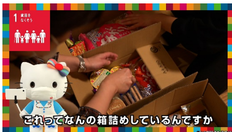
お寺に入ると箱詰め作業中