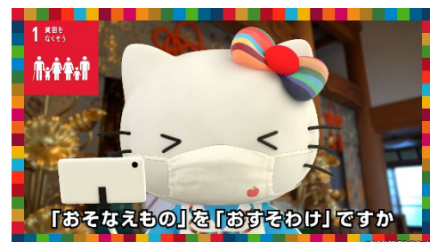
「おそなえ」を「おすそわけ」として聞いて驚くキティ