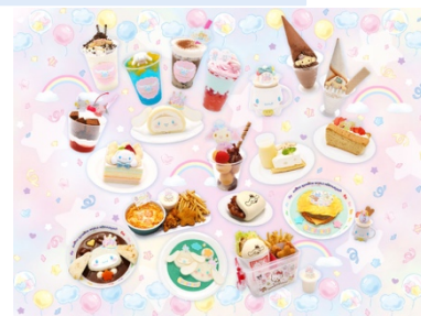
限定フード&スイーツメニューが登場（イメージ）

シナモンだけでなくおともだちも含めたシナモロールの世界観を感じられる、かわいいメニューをお楽しみください。