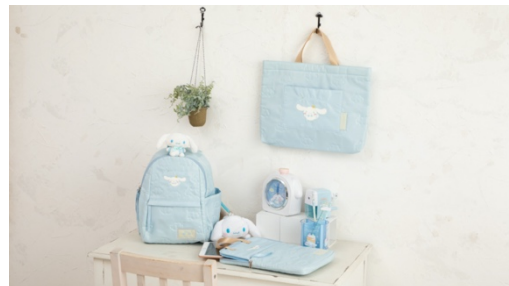
2022年1月発売予定シナモロール ブルーシリーズ

幼稚園、保育園、小学校に通う子どもたちが、通園や通学、習い事やお出かけなど日常的に使えるグッズシリーズ「シナモロール ブルーシリーズ」を展開いたします。リュックや手提げのほか、今では学習面でも必需品となっているタブレットケースなどもラインアップしています。アイテム詳細や販売方法については、1月中旬ごろサンリオ公式ホームページにて公開いたします。