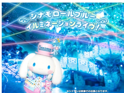
シナモロールブルー イルミネーションライブ！

アイドルデビューもしているシナモンが歌うポップな楽曲に合わせて、1 階ピューロビレッジがイルミネーションの光で輝きます。演出と連動して光るミラクル♡ライトや、20 周年オリジナル応援うちわを持って参加すれば、ライブに参加している気分でもっとショーが楽しめること間違いなし。シナモンも映像で出演し、ショーを盛り上げます。ショーで使用する楽曲はシーズンに合わせ変更予定。1 年間を通じて何度見ても楽しめるショーをお届けいたします。