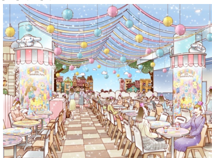
シナモールドリームカフェ（イメージ）

また、3 階エントランスショップ内にもアニバーサリーをお祝いする装飾が登場。ピューロランド限定グッズを探す際にぜひチェックしてみてください。