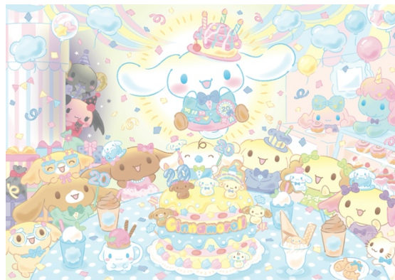
サンリオピューロランド

さらに、アニバーサリーを記念してシナモンとフレンズ5キャラクターがパーティをテーマにした新コスチュームで登場します。シナモンフレンズが大集合する、ミニショー付きの「シナモロール&シナモンフレンズ大集合スペシャルステージ撮影会」（有料）などで間近で見られるチャンスも。シナモロールと“いつも いっしょに”を体感できるアニバーサリーイベントをお楽しみください。