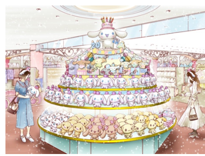
エントランスショップ（イメージ）