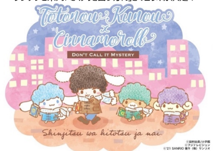
「ミステリと言う勿れ」コラボビジュアル