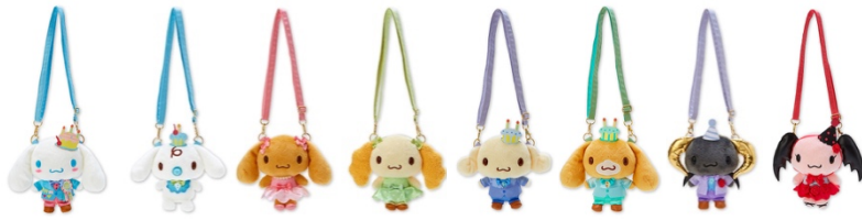
ポシェット (全 8 種) 各 3,850円