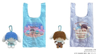
ぬいぐるみエコバッグ（2種） 各1,980円