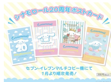
セブンプリントオリジナルポストカード

https://www.sej.co.jp/products/bromide/cnbromide2201.html