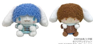
ぬいぐるみ（2種） 各2,420円

●販売ルート：一部のサンリオショップ、フジテレビショップ他（※一部取扱いの無い店舗もございます。）