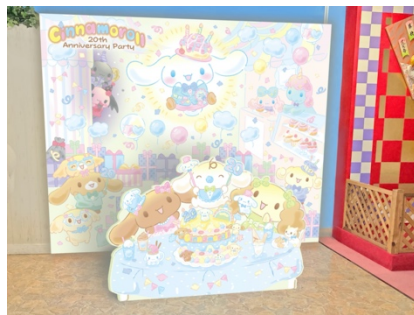
フォトスポット（イメージ）