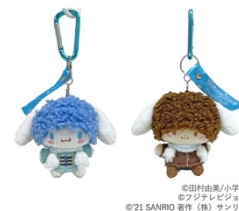
カラビナマスコット（2種） 各1,430円

そのほか、ランチトート（2,200円）、船形ポーチ（1,650円）もラインアップ！