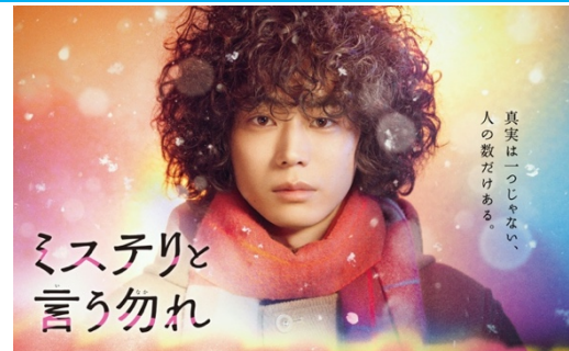
フジテレビ系列「ミステリと言う勿れ」とのコラボが決定！