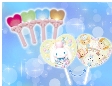
ミラクル♡ライトと 20 周年オリジナル応援うちわ