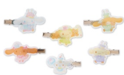
前髪クリップ (シナモンフレンズ 6 個セット) 2,200円