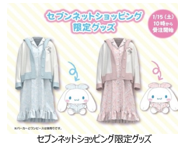
セブンネットショッピング限定グッズ

https://7net.omni7.jp/general/004116/211119cinnamon