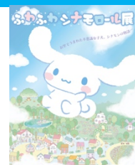
ふわふわシナモロール展

シナモン 15 周年を記念し、2017 年より 9 都市にて開催し全国を巡回している「ふわふわシナモロール展」が、メインビジュアルや展示企画が 20 周年バージョンになってパワーアップします。シナモンのデザインストーリーや貴重なラフ原画など、シナモンの誕生の秘密が楽しめる展覧会です。2022 年 3 月より福岡、岡山、出雲にて開催予定です。