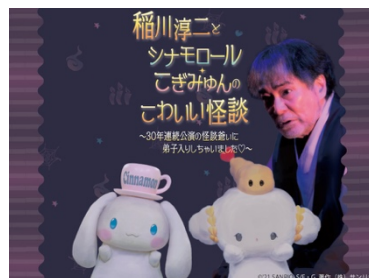
稲川淳二とシナモロール・こぎみゆんのかわいい怪談 ～30年連続公演の怪談爺いに弟子入りしちゃいました♡～ ビジュアル

果たして、シナモンとこぎみゆんは上手に喋ることが出来るのでしょうか。異色のコラボレーションイベントにぜひご期待ください。