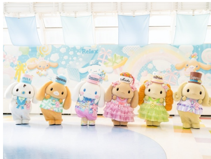
左：アニバーサリーを記念した新コスチューム 右：キャラクターごとに細かいこだわりがたっさん！