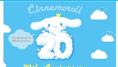
スペシャルサイト（画像はイメージです）

2022年のシナモン20周年を記念し、この20年の思い出をファンの皆さんと振り返るとともに、新たなシナモンの情報を発信していくスペシャルサイトのオープンが決定しました。サイトのテーマは「シナモロールランド」、どんな人でも楽しめて、何度でも訪れたいくなる“オンラインテーマパーク”として展開いたします。スペシャルサイトは、2022年1月14日(金)公開予定です。