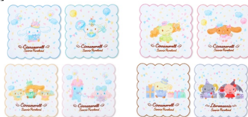
ミニタオル (全 8 種) 各 660円