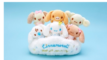
シナモロール 20th ぬいぐるみセット

サンリオショップの初売りでは、20周年を記念し、シナモンとシナモンフレンズたちがベビー姿になって雲の上で遊んでいるぬいぐるみセットを販売いたします。20周年のロゴ入りで、今しか買えない限定感のあるグッズです。