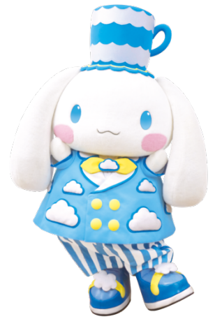
新コスチューム（イメージ）

ハーモニーランド公式ホームページ： https://www.harmonyland.jp/