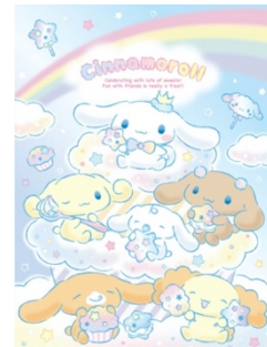
2022年3月発売予定バースデーデザインシリーズ

3月のシナモンのお誕生日にあわせて、22年3月にサンリオショップ、サンリオオンラインショップ向けにバースデーデザインシリーズを発売予定です。たくさんのスイーツでフレンズたちと一緒に楽しくお祝いをしている様子を描いたデザインシリーズです。等身大のシナモンとフレンズのぬいぐるみもラインアップしています。詳細は22年2月下旬にサンリオ公式ホームページにて公開予定です。