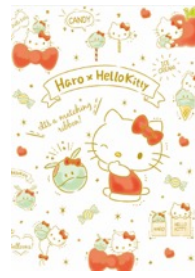
ハロ×ハローキティ