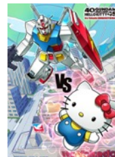
イトーヨーカドー専門店街