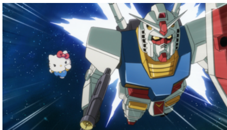
ガンダム(アムロ)を追いかけるキティ