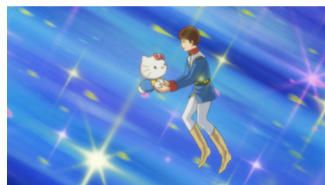
アムロとキティがついに手を取り合う