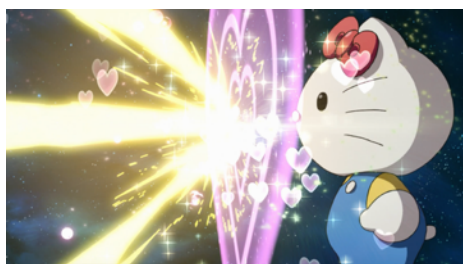
ザクの攻撃を跳ね返すハローキティ

PV最終話視聴URL： https://youtu.be/3orqk_vhepA