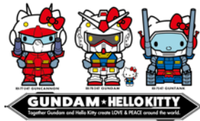
地球連邦軍×ハローキティ

新プロジェクトの「LOVE&PEACE」というテーマのもと、新デザインを描き下ろしました。地球連邦軍やジオン軍になったハローキティ、ハロがハローキティとなかよくおそろいのリボンをつけたファンシーなデザインなど、今後のグッズ展開が楽しみなラインアップです。