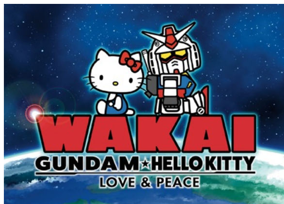
2020年新プロジェクト キービジュアル