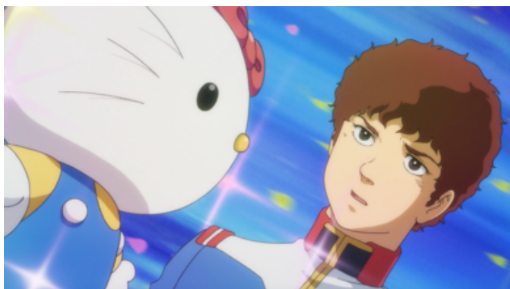
アムロを必死で説得するハローキティ(PV最終話より)

そして、第1&2話がYouTubeで合計200万回再生を叩き出したプロモーションビデオの最終話「愛・戦士」を、2020年1月15日(水)12時よりYouTubeにて公開いたします。