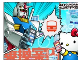
ジョルダン 乗換案内