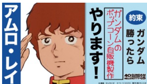
ガンダム 勝利の約束

※ファン感謝祭「春のファン祭り」は、年間ランキングでガンダムチーム・キティチームのそれぞれ1位～500位までにランクインした1000名をご招待する、完全招待制のイベントです。