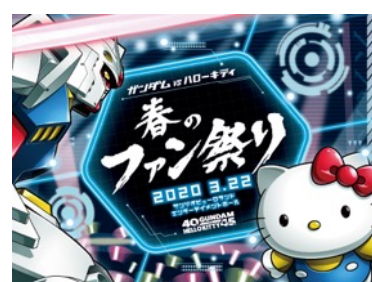
ファン感謝祭のキービジュアル

写真素材ご掲載の際は、必ずコピーライトの記載をお願いいたします。 ©創通・サンライズ ©'76,'20 SANRIO 著作(株)サンリオ