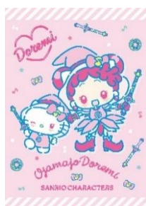
春風どれみ×ハローキティ