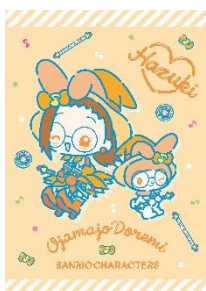
藤原はづき×マイメロディ