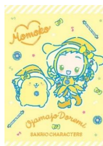
飛鳥ももこ×ポムポムプリン