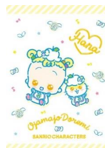
ハナちゃん×コロコロクリン