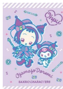
瀬川おんぷ×クロミ