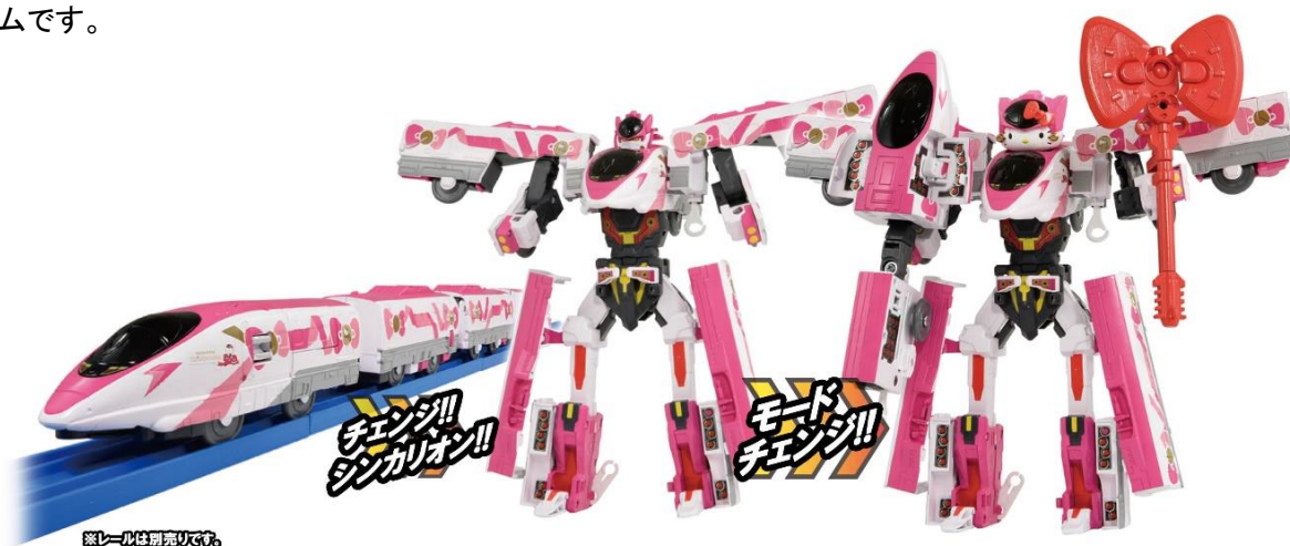
左から：シンカンセンモード、シンカリオンモード、ハローキティモード

ハローキティのフェイスがモチーフの“ハローキティマスク”をかぶせ、“リボンステッキ”を持たせると“ハローキティモード”になります。“リボンステッキ”は、細かいラメのあしらわれたリボン型ステッキで、作中では「一振りでその場にいるすべての人々を幸せにすることができる」という設定のハローキティらしいアイテムです。