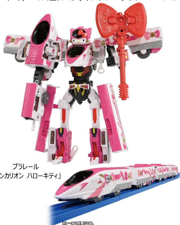
プラレール 「シンカリオン ハローキティ」