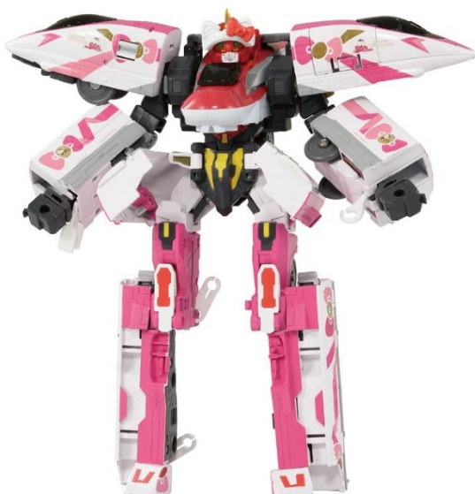
シンカリオン E 6こまちとの合体例

別売りのデラックスシンカリオンシリーズの先頭車(※)と“クロス合体”することで、全5両の車両から成る大型のシンカリオンにパワーアップします。クロス合体時には、ハローキティの耳とリボンをモチーフにした可愛いヘッドパーツ“ヘッドギア(シンカリオン ハローキティ仕様)”を装着させることで、合体後の姿をキュートに演出できます。