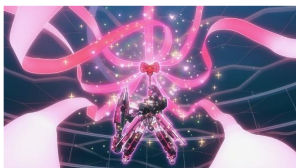
オリジナルコラボアニメーション 場面写真

また、「シンカリオン ハローキティ」は、“ハローキティマスク”をかぶった、カッコよくもキュートな“ハローキティモード”へのモードチェンジや、別売りのシンカリオンとの可愛いクロス合体も可能です。