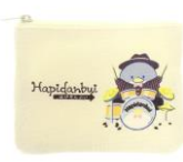
ティッシュポーチ (6デザイン) 各¥1,210