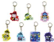
アクリルキーホルダー (7デザイン) 各¥660