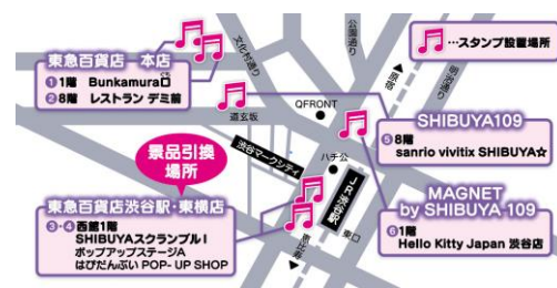
スタンプ設置場所

※景品はなくなり次第終了となります。スタンプブック1冊につきアクリルキーホルダー 1つプレゼントいたします。スタンプラリーへのご参加はお一人様1回までとさせていただきます。