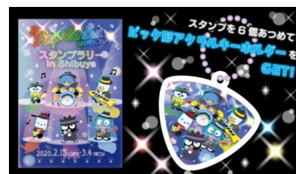
スタンプブック・ピック形アクリルキーホルダー

【景品引換場所】東急百貨店 渋谷駅・東横店西館1階 SHIBUYAスクランブル I ポップアップステージA「はびだんばい」pop-up ショップ