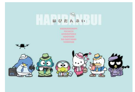
4月下旬発売新デザイン

全国のサンリオショップ・百貨店のサンリオコーナー・サンリオオンラインショップ他にて、「はぴだんぶい」新デザインのグッズを2020年4月下旬より発売することが決定しています。商品ラインアップなどの詳細は、後日サンリオ公式ホームページにて発表しますのでお楽しみに。