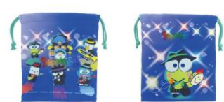
裏 表(6デザイン) 巾着 各¥880