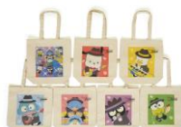
トート (7デザイン) 各¥2,750