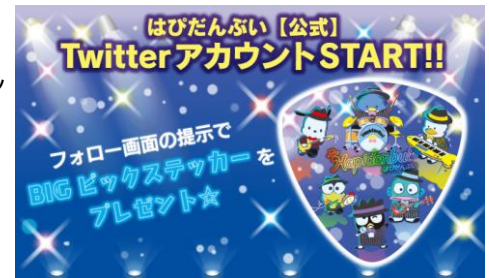
BIGピックステッカー