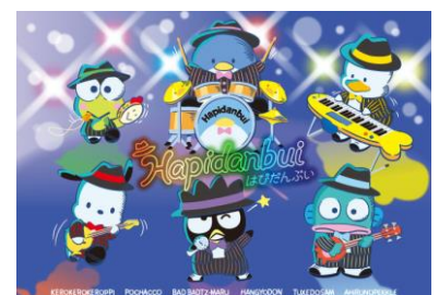
バンドデザインキービジュアル

【場所】東急百貨店 渋谷駅・東横店西館1階 SHIBUYAスクランブル I ポップアップステージA