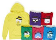
パーカー (6デザイン・M/XL展開) 各¥5,280