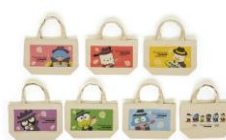
ランチバッグ (7デザイン) 各¥2,200