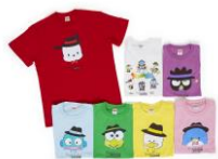
Tシャツ (7デザイン・S/M/L展開) 各¥3,080