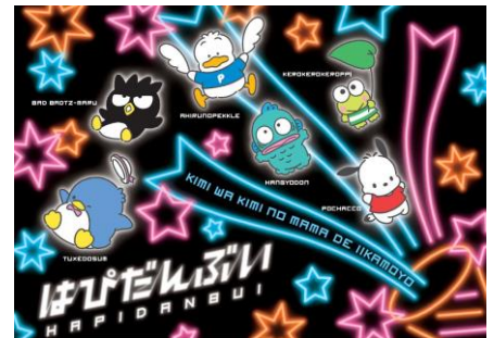
イメージ動画キービジュアル

イメージ動画はYouTubeでも公開中！ URL： https://youtu.be/B-V7j7jwkkE