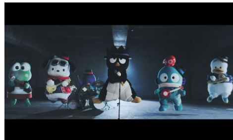
曲に合わせてジャンプするはぴだんぶい