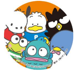
『はぴだんぶい』公式Twitterアイコン