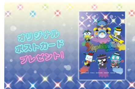
オリジナルポストカード

※Sanrio vivitix サンシャインシティアルパ店での「はぴだんぶい」グッズ発売についての詳細は、サンリオ公式ホームページ( https://www.sanrio.co.jp/news/event-ikebukuro-sunshine-20200318/ )をご確認ください。