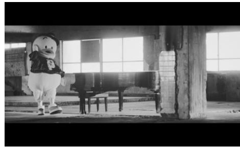
ピアノの傍を颯爽と歩くあひるのペックル