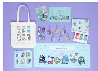
ポーチやタオルなどの小物・雑貨類も！