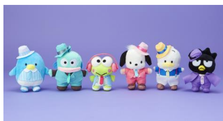
マスクトホルダー

※「はぴだんぶい」新デザイングッズの詳細は、後日サンリオ公式ホームページ( https://www.sanrio.co.jp/ )にてご案内いたします。