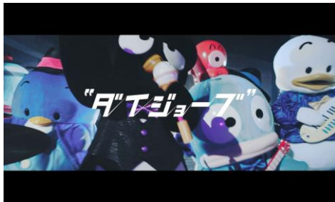
デビュー曲『ダイジョーブ』タイトルバック