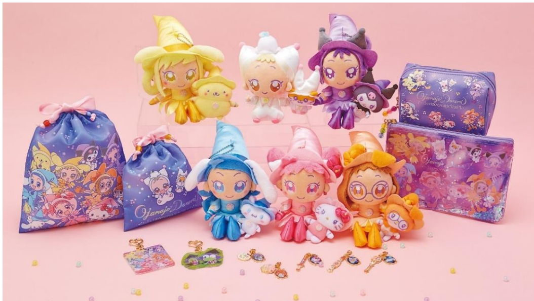
©東映アニメーション ©1976, 1996, 1998, 2001, 2005, 2020 SANRIO CO., LTD. ※写真はサンリオオリジナル商品です。

株式会社サンリオ（本社：東京都品川区、社長：辻 朋邦、以下サンリオ）と東映アニメーション株式会社（本社：東京都中野区、社長：高木 勝裕、以下東映アニメーション）は、サンリオの人気キャラクター達と、東映アニメーション株式会社の「おジャ魔女どれみ」とのコラボレーション商品「おジャ魔女どれみ×サンリオキャラクターズ」を、サンリオとライセンサー各社より2020年7月30日（木）に発売します。