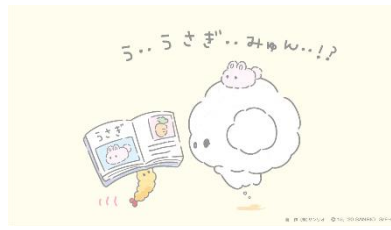
4月26日(日)Twitterより ピンク色のコギムナーと思っていた子は、 本当はうさぎさんでした。