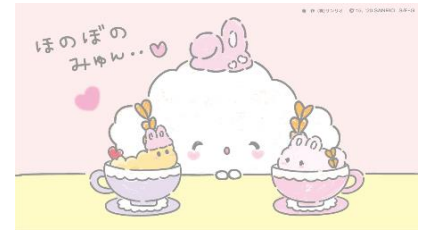
5月10日(日)Twitterより こぎみゆんとお揃いの麦の飾りやうさ耳を付け たりして、もっとなかよくなりました。