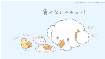
4月21日(火)Twitterより お世話を少しずつ仲良くなりますが 少し様子が違います。