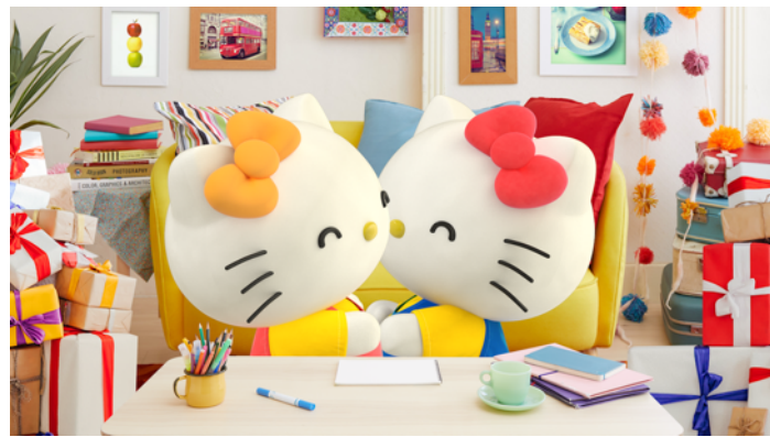
「キティとミミィがいつまでも仲良くいれる魔法」のプレゼントにキティとミミィがハグ