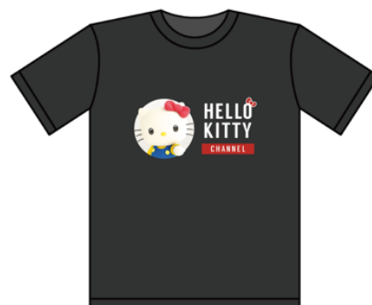
ハローキティチャンネルオリジナルTシャツ イメージ

キャンペーンページ： https://www.kittyhappybirthday.jp/