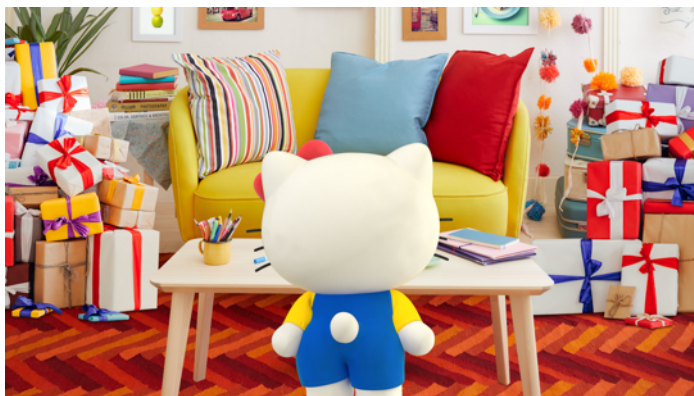
空想プレゼント「ポップコーンマシン50台」に、おしりをフリフリして踊り出すキティ