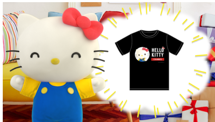
キティからみんなへの逆プレゼントとして、プレゼントキャンペーンの実施を発表